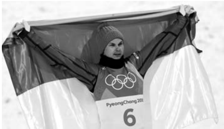
На фото: фрістайліст Олександр Абраменко здобув золоту медаль у лижній акробатиці на Олімпійських іграх у Південній Кореї

До слова, на «білій» Олімпіаді в Південній Кореї побито рекорд за кількістю комплектів медалей (102) завдяки додаванню нових дисциплін у програму. Вперше на Олімпійських іграх відбулися змагання зі сноуборду в категорії біг-ейж, мас-старт у ковзанярському спорті, командні змагання в гірськолижному спорті, дабл-мікст у керлінгу.