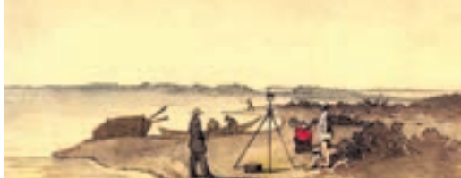
Т.Г.Шевченко. Т. Г. Шевченко серед учасників експедиції на березі Аральського моря. Папір, акварель. [12-21.IX 1848; 22-30.VIII 1849].

Отже, не тільки художники і поети можуть вважати Тараса Шевченка своїм колегою, він належить і до професійного братства археологів та краєзнавців.