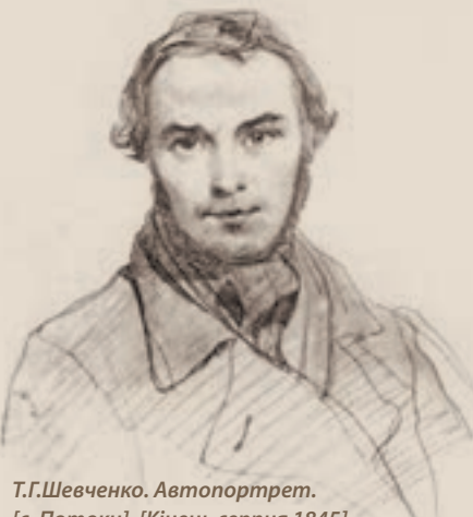
Т.Г.Шевченко. Автопортрет. [с. Потоки]. [Кінець серпня 1845]

Ми знаємо офіційну біографію Тараса Шевченка, втім часто поза увагою залишаються цікаві факти із життя Кобзаря. Тож спробуймо привідкрити бодай трохи завісу невідомого про Шевченка.