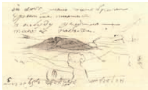
Т.Г.Шевченко. Могила Переп'ят та інші начерки. Олівець. [1846 - 1850].