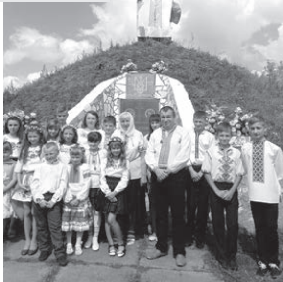
Громада села біля осучасненої могили Січових Стрільців