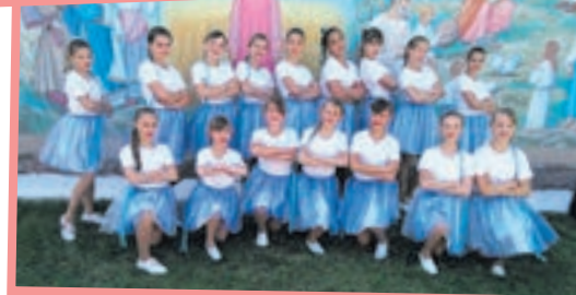
Учасники танцювального колективу «ВИКРУТАС»