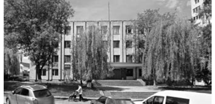
Графік роботи ЦНАП: понеділок, вівторок, середа — з 8:00 до 17:15; четвер — з 8:00 до 20:00; п'ятниця — з 8:00 до 16:00; субота та неділя — вихідні. Графік прийому суб'єктів звернення: понеділок, вівторок, середа — з 8:30 до 16:30; четвер — з 8:30 до 19:30; п'ятниця — з 8:30 до 15:30.

— На моє переконання, відкриття Центру значно полегшило життя тисяч громадян. До нас за отримання адмінпослуг щодня звертається чимало людей, які раді тому, що завдяки функціонуванню Центру зникла потреба звертатися до різних адміністративних органів і суттєво покращилася якість та оперативність надання адміністративних послуг. Станом на сьогодні в Центрі громадяни та суб'єкти підприємств мають можливість отримати 122 види послуг. Та най-