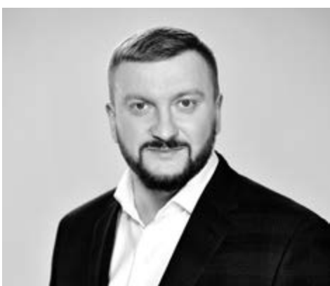
Консультації міністр юстиції України Павло Дмитрович Петренко.

15 травня Верховна Рада підтримала у першому читанні другий пакет законів у рамках ініціативи Міністерства юстиції #ЧужихДітейНеБуває. Зміни стосуються підвищення відповідальності боржників зі сплати аліментів, посилення захисту матеріального стану дитини та запровадження системи стимулів для тих, хто дбає про наймолодших українців.