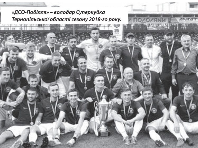
«ДСО-Поділля» – володар Суперкубка Тернопільської області сезону 2018-го року.