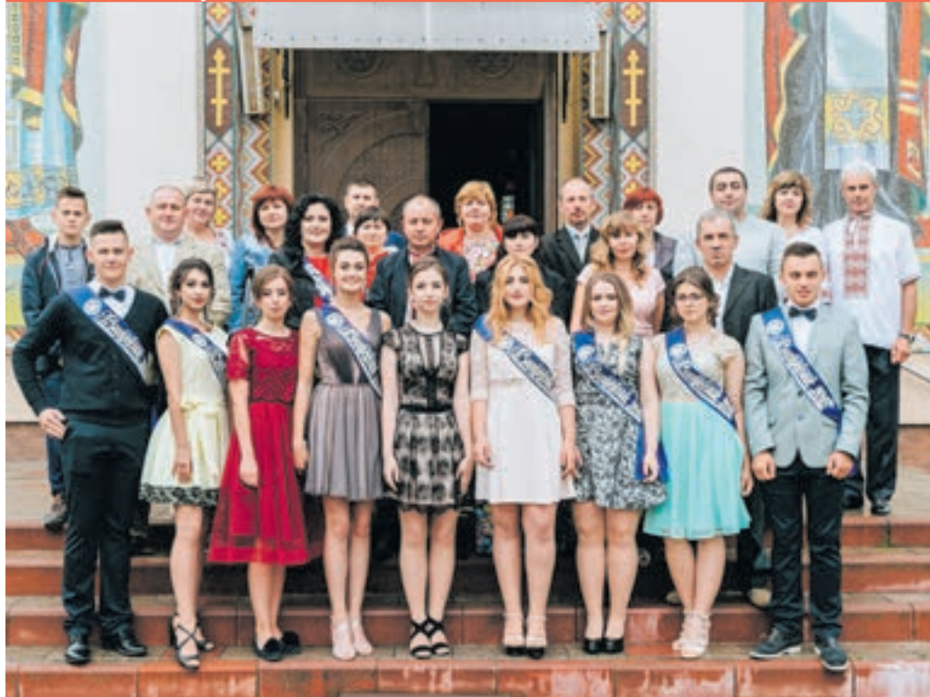
Випускники 2018 р. Великобerezовицької ЗОШ I-III ст. та їх батьки.