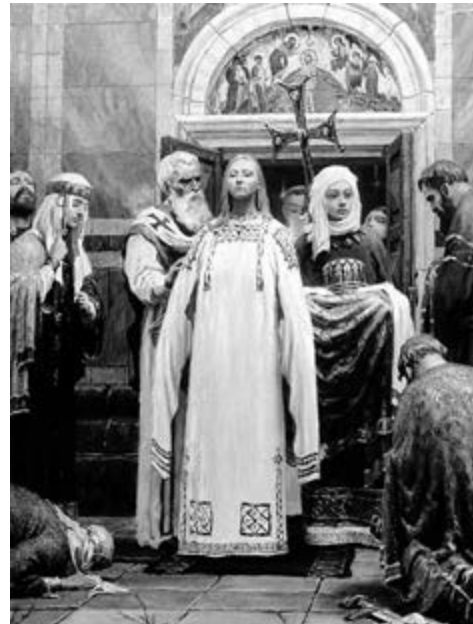
«Хрещення княгині Ольги», художник Сергій Кирилов

тої Софії в місті Константинополь імператор особисто хрестив Ольгу. Їй дали ім'я Олена. Здавалося, тепер не було перешкод до заміжжя. Але після хрещення хитра Ольга заявила, що вийти заміж за хрещеного батька не може. Так вона обвела навколо пальця самого візантійського імператора. І домоглася свого: про Київську Русь дізналися у Візантії і з цього часу почали її підтримувати. Гарантією такої підтримки було прийняття нею християнство, яке незабаром стане панівною релігією на Русі.