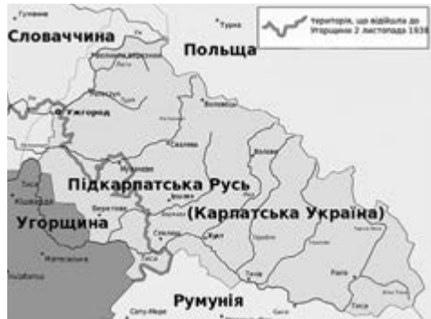
Манна Карпатської України з територіальними претензіями Угорщини

цлер Німеччини А. Гітлер дозволив Угорщині анексувати Карпатську Україну і тим самим показав, що не збирається розв'язувати українське питання.