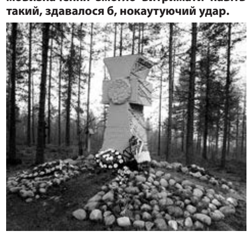
Український козацький хрест в урочищі Сандармох

Початком масового нищення української інтелігенції вважається 1933 року, коли 12-13 травня відбувся арешт Михайла Ялового і самогубство Миколи Хвильового у, недоброї пам'яті, харківському будинку «Слово» на вулиці Культури, 9. Кульмінацією ж дій радянського репресивного режиму стали масові розстріли «контрреволюціонерів», вчинені напередодні 20-річчя жовтневого перевороту. Так, 3 листопада 1937 року в урочищі Сандармох (Карелія) за рішенням «трійки» було страчено велику групу в'язнів Соловецької тюрми. У списку «українських буржуазних націоналістів», розстріляних того дня, були: Лесь Курбас, Микола Куліш, Матвій Яворський, Володимир Чеховський, Валер'ян Підмогильний, Павло Филипович, Валер'ян Поліщук, Григорій Елік, Мирослав Ірчан, Марко Вороний, Михайло Козоріс, Олекс Слісаренко, Мохильо, Михайло Козоріс. Така ж доля, в один день, за рішенням несудового органу, було страчено десятки представників української інтелігенції — цвіт української нації. За деякими даними, кількість жертв репресій серед представників Червоного ренесансу сягнула 30 тис. осіб. Проте, як виявилось, українське прагнення до самовизначення змогло витримати навіть такий, здавалося б, нокаутуючий удар.