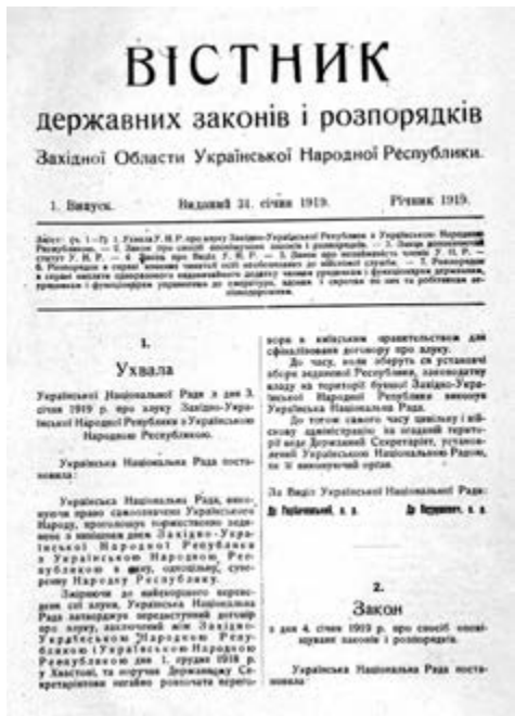
Західноукраїнське звiщення про Акт Злуки, січень 1919

Враховуючи політичну ситуацію, керівники обох українських держав вирішили об'єднатися, сподіваючись, що це зробить їх сильнішими перед зовнішніми ворогами. 1 грудня 1918 року делегація УНРади і представники Директорії УНР підписали у Заустві Акт про об'єднання УНРади і УНР. А 22 січня 1919 року в Києві відбулося урочисте проголошення Акта про Злуку ЗУНР (Галичина) і УНР (Наддніпрянська Україна) в єдину соборну Українську Народну Республіку. Згідно з законом «Про форму владу в Україні», ЗУНР отримала назву «Західна Область Української Народної Республіки» (ЗО УНР, ЗОУНР).