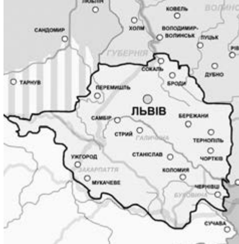
УНР у жовтні 1918 року:

прапор — синьо-жовтий. Національним меншинам гарантували рівні права з українським населенням.