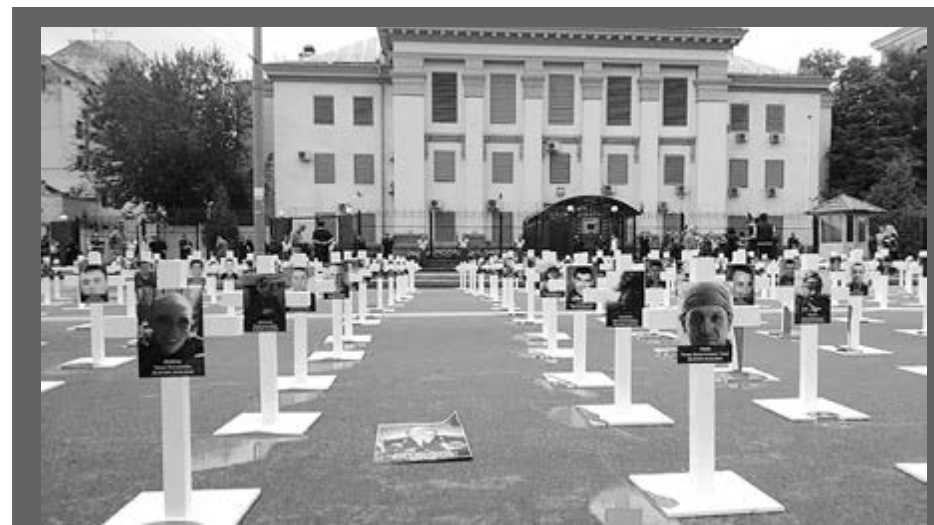
29 серпня — День пам'яті полеглих під Іловайськом українських воїнів. Під посольством Російської Федерації в Києві активісти провели акцію «Путін, за Іловайськ відповиси» та встановили на проїжджій частині 366 білих хрестів на знак пам'яті про жертви Іловайської трагедії. До акції долучилися кілька сотень учасників. На заході було чимало людей у військової формі, добровольці, родичі й друзі загиблих.