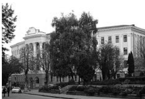
Тернопіль, ЗОСШ №4. У цій будівлі у листопаді-грудні 1918 року перебував уряд ЗУНР.

Ворог відреагував миттєво... Вже 21 листопада польські війська захопили Львів (біля м. Перемишля не змогли зруйнувати мости, і польські війська приїхали на залізничний вокзал у Львові). Своєю чергою, румунські війська окупували Чернівці. Уряд ЗУНР змушений був переїхати до Тернополя.