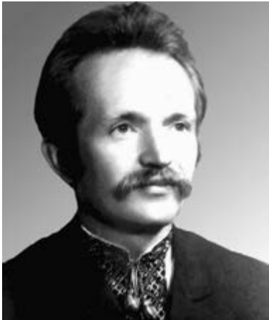
В'ячеслав Чорновіл. Початок 1970-х

Таким чином, нехай шістдесятники і не боролися за незалежність, але з середини 1960-х вони розпочали формування політичної опозиції комуністичному режиму і незабаром стали активними учасниками дисидентського руху в Україні, зокрема, як члени Української гелісінської групи.