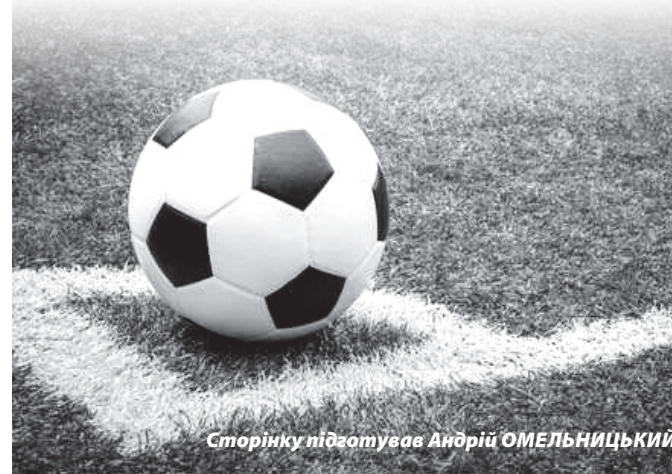
Сторінку підготував Андрій ОМЕЛЬНИЦЬКИЙ.