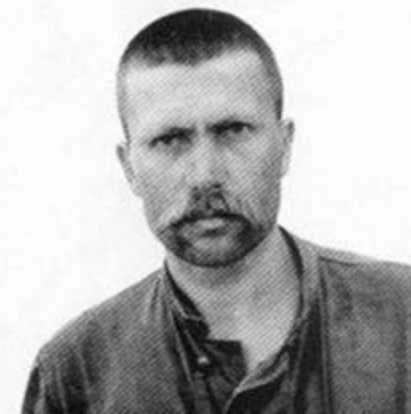
Левко Лук'яненко. 1980.

Наприкінці червня 1988 р. стає ініціатором та ідейним натхненником створення Української гелісінської спілки — першої в Україні опозиційної до радянської влади політичної партії. Фактично, цього дня завершилася монополія Компартії в Україні. 7 липня 1988 року на 50-тисячній мітингу у Львові Чорновіл офіційно оприлюднив Декларацію принципів Української гелісінської спілки, співголовою якої став, а посаду голови залишив Левку Лук'яненку.