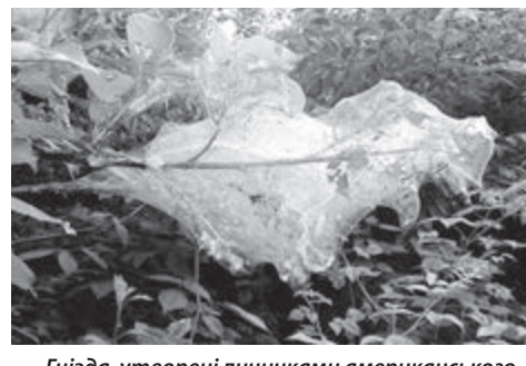
Гнізда, утворені личинками американського білого метелика

— на присадибних ділянках перекопка ґрунту для знищення лялечок низькими температурами.