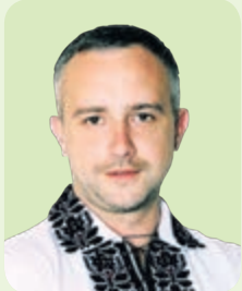
Олександр ПОХИЛИЙ, голова Тернопільської райдержадміністрації