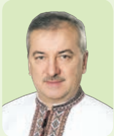
Андрій ГАЛАЙКО, голова Тернопільської районної ради