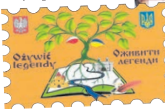
Учні ІV ліцею ім. генерала Станіслава Мачка з м. Катовіце