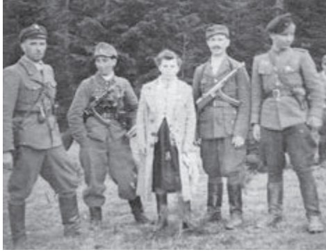
Зліва направо: «Осип», «Явір», «Нуся», «Орлик», «Погода».

Нікнейми. В усіх повстанців для надійної конспірації було по кілька псевдонімів. Більшість із них — похідні від назв тварин, птахів, рослин, предметів. Були також нікнейми, похідні від назв явищ природи: «Хмара», «Мороз», «Крига», «Зима», «Місяць» тощо. Найекзотичніші: «Непита», «Непей», «Вгадай», «Зірвишапка», «Розбийгора».