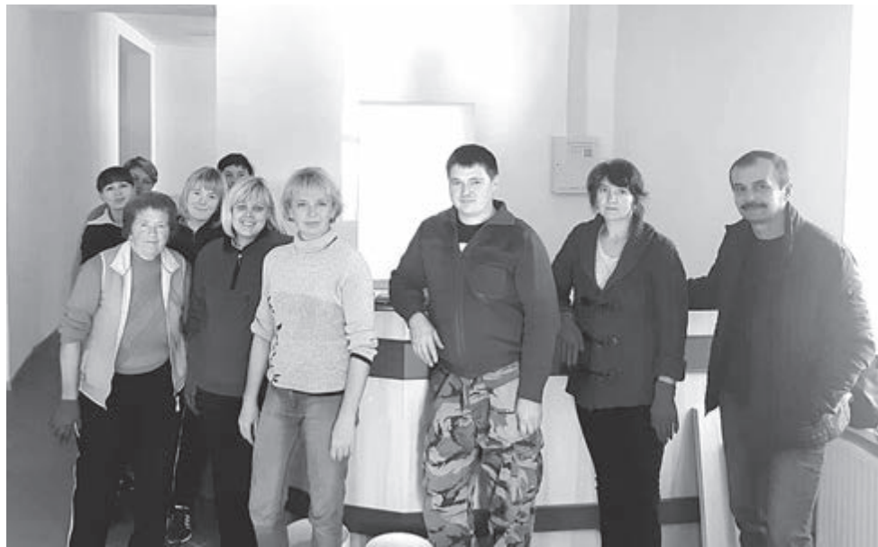
Працівники амбулаторії готують приміщення до роботи.