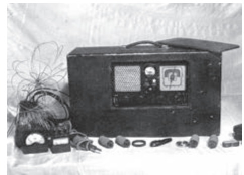
Радіоприймач, вилучений радянськими спецслужбами з останньої криївки Романа Шухевича. 1950 р.

полону і приєднався до ОУН. У 1944 р. став командиром сотні «Сіроманці» у складі ВО-3 «Лисоня» УПА-«Захід». 29 квітня 1944 р. його відділ знищив близько 200 енкавеевських поблизу с. Залізниці на Кременецькій залізниці. 30 вересня 1944 р. «Сіроманці» відбили 22 атаки численніших сил НКВС поблизу с. Угнів (Львівська обл.) та вивалилися з оточення. Загинув 17 грудня 1944 р. під час атаки на райцентр Нові Стрелища, коли повстанці спалили урядові будівлі та звільнили політв'язнів. Його посмертно нагородили Золотою Хрестом Бойової Заслуги першого класу.