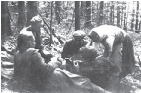
Місцева жінка годує в лісі воїнів УПА.