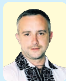
Олександр ПОХИЛИЙ, голова Тернопільської райдержадміністрації