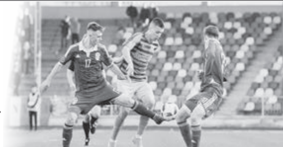
футболісти тернопільської «Ниви» забили 2 «сухі» м'ячі «Чайці» з Петропавлівської Борщагівки