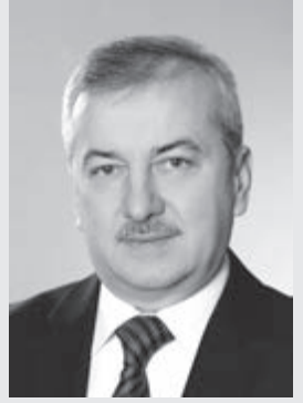
Андрій ГАЛАЙКО, голова Тернопільської районної ради