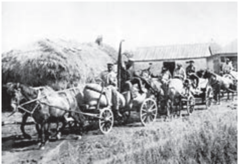
Вийзд червоної валки з хлібом. Колгосп «Хвиля пролетарської революції», Харківська область, 1932 рік

А за кілька днів почалися арешти. Слідство дуже швидко знайшло винних, повісивши всі звинувачення на «куркульських недобитків» — селян-одноосібників.