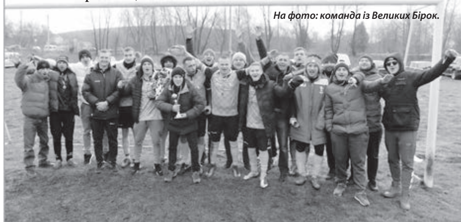
На фото: команда із Великих Бірок.

Минулої неділі на стадіоні селища Велика Березовиця відбувся фінальний матч Кубка Тернопільського району з футболу на приз «Золота осінь», у якому зустрілися команди Великих Бірок та Великої Березовиці.