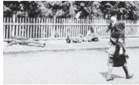
Жертви голоду на вулицях Харкова — столиці УСРР, 1933

Більшість загиблих від голодомору — діти! Українці віком від 6 місяців до 17 років становили близько половини всіх жертв голодомору.