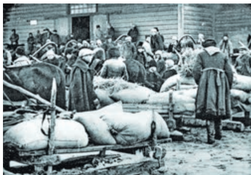
Селяни здають хліб у Барішівському районі Київської округи, 1930 рік

У 1930 році генсек Йосип Сталін дав поштовх новій хвилі колективізації. У квітні того ж року було прийнято «Закон про хлібозаготівлі», згідно з яким колгоспи зобов'язали здавати державі від чверті до третини зібраного збіжжя. Тим часом внаслідок «великої депресії» ціни на сільськогосподарську продукцію на Заході стрімко впали. Радянський Союз став на порозі економічної кризи, адже довгострокових позик йому ніхто не давав, вимагаючи визнати за собою борги Російської імперії. Щоб заробити валюту, було вирішено збільшити обсяги продажу зерна, внаслідок чого хлібозаготівельні плани різко і невмотивовано зростали, з колгоспів забирали майже весь урожай, що спонукало селян відмовлятися від праці на землі і породило масову неконтрольовану урбанізацію.