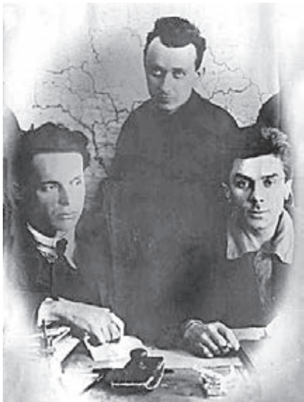
У редакції журналу «Всесвіт» (зліва): Олександр Довженко, Кость Гордієнко, Микола Хвильовий (Харків, 1925)

Микола Хвильовий намагався розтлумачити зміст висунутих ним закликів і гасел («Геть від Москви!», «До психологічної Європи», «Азіатський ренесанс»), пояснював опонентам, що зовсім не закликає до розриву політичного й економічного союзу з радянською Росією. Однак дискусія набула політичного звучання, тож культурологічні проблеми опоненти вже не брали до уваги.