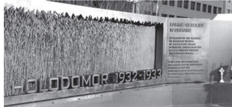
Holodomor Memorial to Victims of the Ukrainian Famine-Genocide of 1932-1933. Washington, D.C., United States

Можливо, всі наші сучасні біди — це наслідок са-танинської селекції, під час якої була фізично знищена найкраща частина українського народу, а решта — деморалізована.