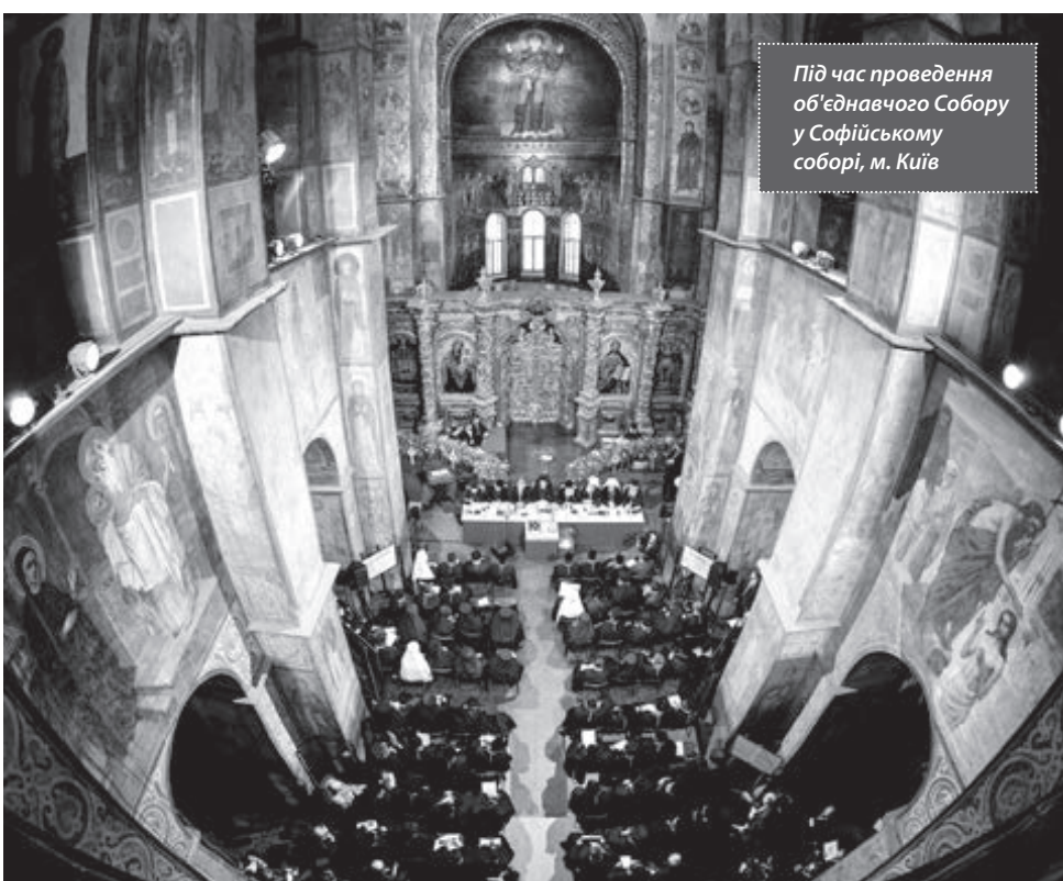
Під час проведення об'єднавчого Собору у Софійському соборі, м. Київ

Перший публічний виступ новообраного Митрополита Київського і всієї України запам'ятав закликом до всіх вірян, святихників і єпископів, які досі цього не зробили, приєднатися до нової церкви.