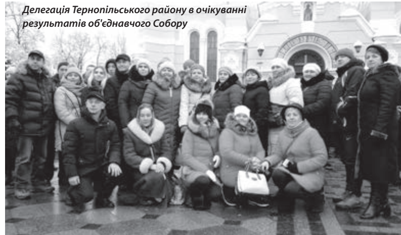
Делегація Тернопільського району в очікуванні результату об'єднавчого Собору

Помісна Українська церква народилася. Вона ще не має «свідчення про народження», яке новообраний Предстоятель Православної церкви України Епіфаній має отримати з рук Варфоломія 6 січня. Але вже живе, і для нас усіх важливо, яким шляхом вона піде. Багато в чому це залежатиме й від позиції Епіфанія, від його світоглядних цінностей, життєвих принципів, від розуміння ролі Православної церкви в житті країни, особливо в нинішніх складних умовах війни й боротьби за єдність нації.