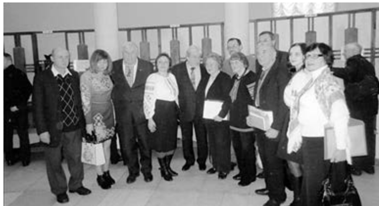
Делегація Тернопільщини на X-му з'їзді «Просвіти».