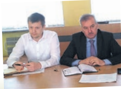
Під час чергового засідання організаційного комітету щодо проведення творчих звітів Тернопільського району, присвяченого Дню матері, «Бережіть матерів».

біографії. Брав участь у першому звіті як керівник аматорського фольклорного колективу «Настав, спочатку музику, наступні готував, будинку культури, згодом — як начальник відділу культури РДА. Це важка організаторська робота. І чим вона важча, тим кращий концерт. Основна нагорода для організаторів та учасників творчого звіту — це повна зала та вдячні оплески глядачів».