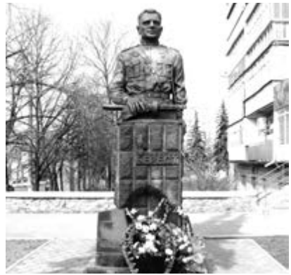
Пам'ятник Бересту в місті Охтирка Сумської області.

Його особистість втілює найкращі риси старшого покоління українців, а його життєвий шлях нагадує нам про те, що гідно прожити життя навіть найкращі представники нашого народу зможуть лише в національній державі, опорою якої є природні традиційні принципи.