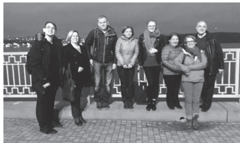
Учасники благодійного проекту Kybele на відпочинку в Тернополі.

тесті. Жінка не відчуватиме болю, буде при свідомості та зможе побачити своє маля, почути його перший крик».