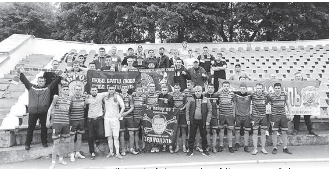
На фото: футболісти тернопільської «Ниви» з власними вболівальниками.

У двох поспіль поєдинках чемпіонату України серед команд другої ліги тернополяни здобули перемоги.