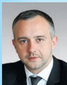
Олександр ПОХИЛИЙ, голова Тернопільської райдержадміністрації