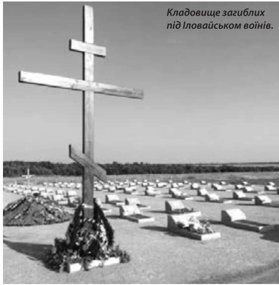
Кладовище загиблих під Іловайськом воїнів.

24 серпня Президент Зеленський підписав указ про щорічне відзначення 29 серпня Дня пам'яті захисників, які загинули у боротьбі за незалежність, суверенітет і територіальну цілісність України.