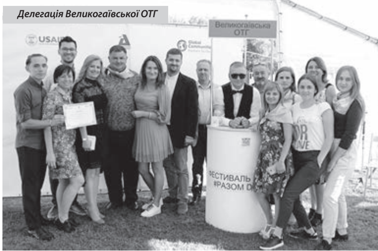
Делегація Великогаївської ОТГ