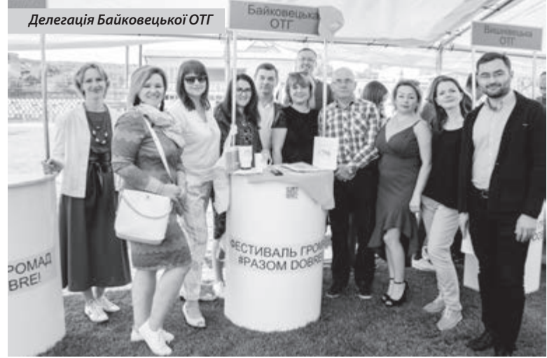
Делегація Байковецької ОТГ