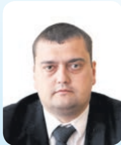
Володимир ОСЯДАЧ, в. о. голови Тернопільської райдержадміністрації