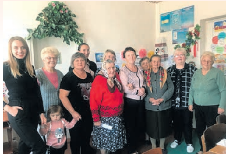
Підопічні та працівники Терцентру у с. Мишковичі