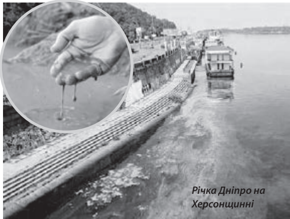
Річка Дніпро на Херсонщині

Перша — обміління, яке відбувається внаслідок твердого стоку приток, таких як Десна, Прип'ять тощо. Друга — цвітіння води. 3 року в рік стає тепліше, люди з фактатом зливають у каналізацію мийні засоби з фосфатами. Вони потрапляють у Дніпро, стають поживною базою для ціанобактерій, внаслідок життєдіяльності яких річка зеленіє. Третя — заростання водним горіхом водосховищ. Щороку заростає близько 5% Київського водосховища, і через це його площа, за оцінками вчених, зменшується на 2 квадратних кілометри. Четверта — браконьєрство, через яке риби в Дніпрі стає все менше.