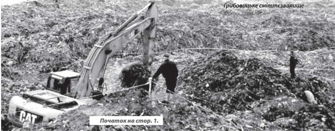
Початок на стор. 1.

Грибовицьке сміттєзвалище