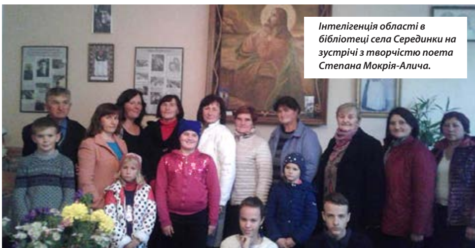
Інтелекція області в бібліотеці села Серединки на зустрічі з творчістю поета Степана Мокрія-Алича.

Знемагаючи від болю, Степан писав вірші, які збереглися б лише у рукописах або й пропали б, якби про чоловіка випадково не довідалися тернопільські літератори, зокре-