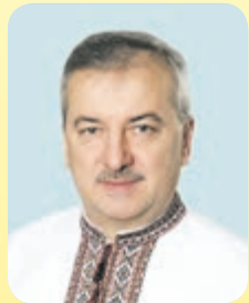
Андрій ГАЛАЙКО , голова Тернопільської районної ради