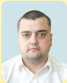
Володимир ОСЯДАЧ , в. о. голови Тернопільської райдержадміністрації