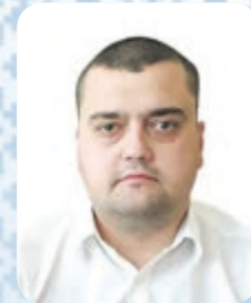
Володимир ОСЯДАЧ, в. о. голови Тернопільської райдержадміністрації