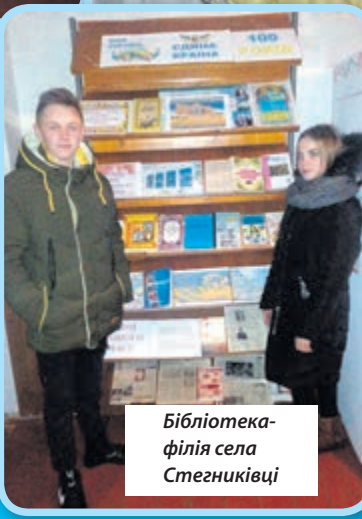
Бібліотека-філія села Стегниківці