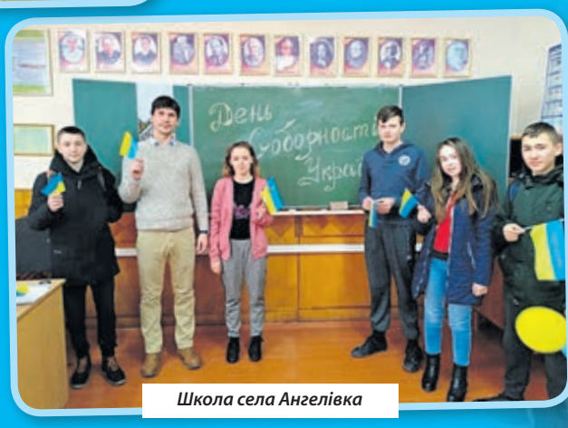
Школа села Ангелівка