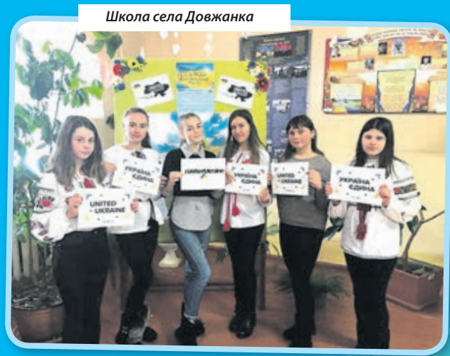
Школа села Довжанка