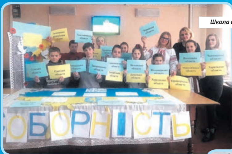
Школа села Буцнів