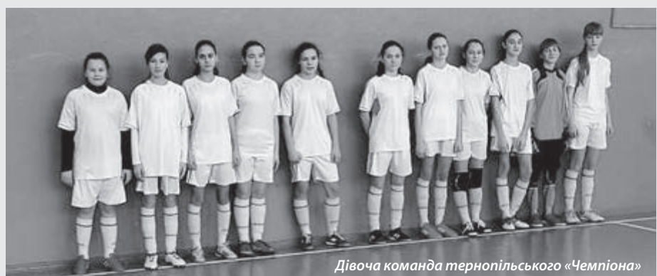
Дівоча команда тернопільського «Чемпіона»

Дівоча команда тернопільського «Чемпіона» (дівчата 2004-2005-го років народження) виборола бронзові медалі у другому етапі чемпіонату України з футболу в Хмельницькому.