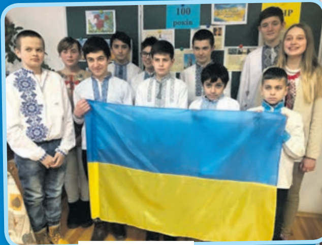
Школа села Біла

Остання декада січня сповнена знаковими подіями в історії України. 22 січня ми відзначали 100-річчя проголошення Акта злуки всіх українських земель в єдину Українську державу — День Соборності; 27 січня згадували жертв голокосту; 29 січня вшанували пам'ять героїв Крут. Сумними подіями увійшли до історії нашої держави — 22 січня 2014 відкрився страшний рахунок Героїв Небесної сотні; 20 січня Україна відзначала День пам'яті захисників Донецького аеропорту (ДАП), оборона якого тривала 242 дні — з вересня 2014 року до 22 січня 2015 року. У школах, бібліотеках та будинках культури району відбулися заходи, присвячені тим подіям.