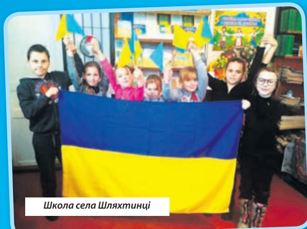
Школа села Шляхтинці