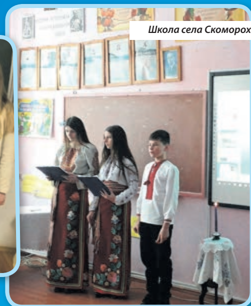
Школа села Скоморохи