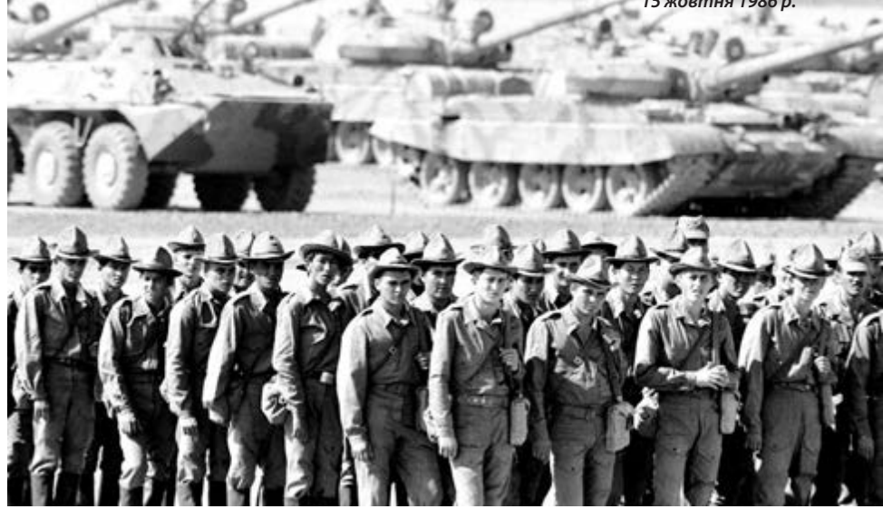
Радянські солдати повертаються із Афганістану, 15 жовтня 1986 р.

Афганістан завжди був однією з найбідніших країн світу, що зумовлено, насамперед, географічним положенням країни, рельєфом місцевості (80% території — гори та безводні пустелі), а також особливостями релігійної свідомості афганських племен (збиваю спокую є аскетизм та консерватизм у повсякденному житті).