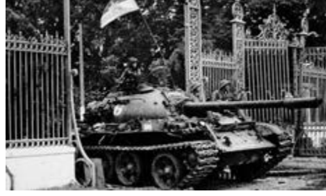
Танк армії Північного В'єтнаму заїздить на подвір'я президентського палацу в Сайгоні. 30 квітня 1975 р.

ві операції поступово скорочувалися. 10 травня 1968 року, незважаючи на існуючі протиріччя, розпочалися мирні переговори між США і Демократичною Республікою В'єтнаму, які тривали безрезультатно 5 місяців. Починаючи з 1968 року американські війська поступово залишали місця дислокації у прикордонних регіонах і переміщалися у прибережну смугу. Останній солдат армії США залишив територію В'єтнаму у серпні 1972 року.