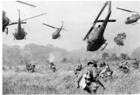
Вертольоти армії США ведуть кулеметний вогонь по лінії дерев, прикриваючи наступ південнов'єтнамської Березень 1965 р.

Ліндон Джонсон, ставши після вбивства Джона Кеннеді 36-м президентом США, сказав, що бітву проти розповсюдження атомної зброї в усюди мінцю та рішучістю об'єднаних зусиллями вільного світу. 2 серпня 1964 року військовий корабель США, який виконував розвідувальне завдання поблизу берегів Південного В'єтнаму в зоні Тонкінської затоки, за твердженнями американців, раптово атакували північно-в'єтнамські військово-морського флоту. Через дві доби у цьому ж регіоні за незрозумілих обставин інший американський корабель також був атакований. Навіть до кінця не з'ясувавши обставин інциденту, Ліндон Джонсон видає наказ про так звану акцію відплати — американські ВПС бомбардують територію Північного В'єтнаму. Як стало відомо з матеріалів опублікованого у 2005 році таємного документа, ніякого інциденту 4 серпня не було. Джонсон, та його прибічники навмисно брехали, оскільки їм був потрібен привід для масштабного втручання у В'єтнамську війну.