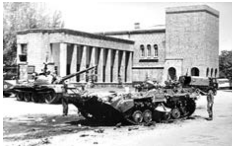
Кабул, 28 квітня 1978 р.

У квітні 1978 року комуністам, завдяки допомозі радянських спецслужб, вдалося здійснити антидержавний «революційний» збройний заколот, який у прокомуністичній історіографії отримав назву «Саурська революція». Президент генерал Дауд Хан був убитий. До влади прийшов лідер фракції «Хальк» і одночасно генеральний секретар місцевої Комуністичної партії Нур Мухаммед Таракі. Він став головою Революційної ради і прем'єр-міністром Афганістану.