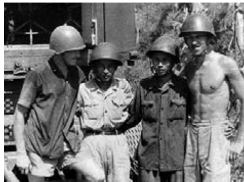
Радянські солдати з офіцерами 7-го зенітно-ракетного полку ВНА. Квітень 1967 р.

У відповідь на бомбардування Північного В'єтнаму СРСР розпочинає постачання до країни зенітно-ракетних комплексів С-75.