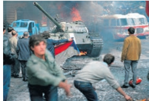
Чехи будують огорожі та атакують радянські танки перед будівлею Чеського радіо у Празі. 1968 рік

Таким чином, період політичного лібералізму в ЧССР закінчився в ніч з 20 на 21 серпня ввведення в 200 000 солдатів і 5000 танків країни Варшавського договору. Звичайно ж, найбільший контингент військ був від СРСР. Напередодні маршал Радянського Союзу Гречко інформував міністра оборони ЧССР Мартіна Дзура про підготовку акцію і застеріг від опору. Чехословацька армія не чинила спротиву. Введені війська перебували в країні до 1990 року.