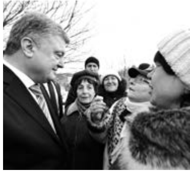
льярда. Ніхто не буде розмитнювати», — зауважив він.

Президент нагадав про труднощі, які виникли із вирішенням питання щодо розмитнення автомобілів на європейських номерах, що були ввезені в Україну із порушенням митного та податкового законодавства. «Нам тоді сказали: ви не зберете навіть одного мі-