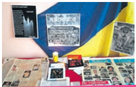
Виставка у Соборненській бібліотеці-філії.