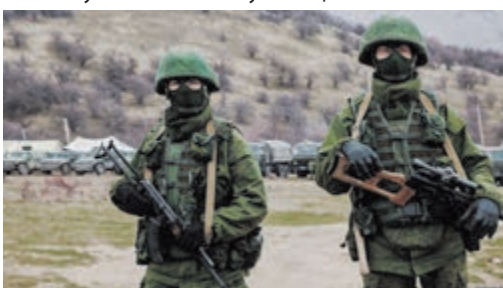
Російські військові в кримському селі Перевальне, 4 березня 2014 року.

Упродовж наступних кількох днів вулиці міст заповнили російські війська. Вони захопили адміністративні будівлі, взяли в облогу гарнізони Збройних сил України, морські порти і аеропорти. Керівництво Росії неодноразово стверджувало, що ці озброєні люди не є російськими військовослужбовцями. Однак після окупації півострова і проведення там фейкового референдуму про статус Криму росіяни визнали, що «зелені чоловічки» були військовослужбовцями ЗС РФ.