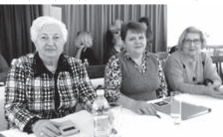
Пленум ЦК профспілки у Києві 06.12.2018

— Два звітних періоди протягом 10 років мене обирали членом центрального органу профспілки працівників культури України. Хочу сказати, що у профспілках працівників галузі культури налагоджена потужна