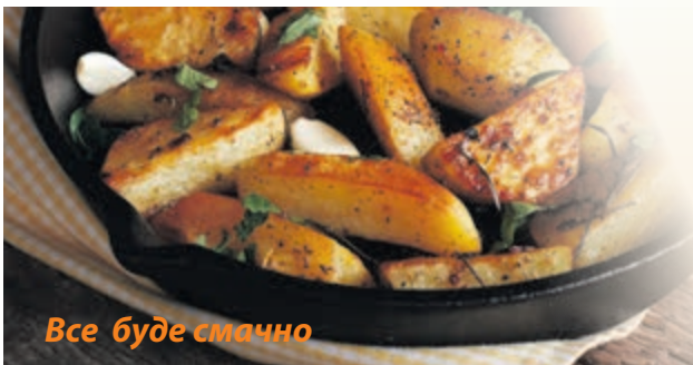
Все буде смачно