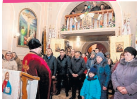
Панахида за героями в селі Курники.

правда. Бо ще не всі ми, ще не вся Україна усвідомила, що тиша у своїй хаті таки краше, аніж ділати її з зайдами і годувати їх. Бо вони цілі, і вони захочуть вигнати нас з нашої домівки. А у своїй хаті, як писав наш пророк Тарас Шевченко, «своя правда, і сила, і воля...»