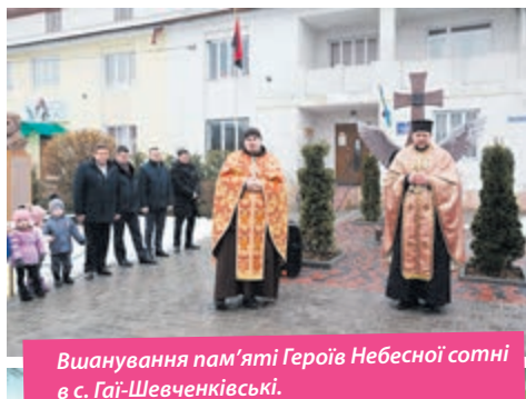
Вшанування пам'яті Героїв Небесної сотні в с. Гаї-Шевченківські.

У Гаях-Шевченківських перед вечором-реквіємом біля пам'ятного знаку Героям Небесної сотні відбулася панахида.