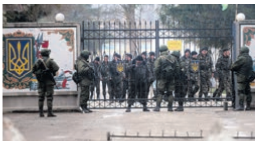
Захоплення військової частини в Криму.

16 березня, попри призупинення рішення кримського парламенту Верховною Радою України, так званий референдум щодо статусу Криму провели. Він відбувся з численними порушеннями та фальсифікаціями, за присутності великої кількості озброєних російських військових. Через кілька днів, 18 березня, сепаратистське керівництво півострова підписало в Москві «Договір про прийняття Криму до складу Росії».