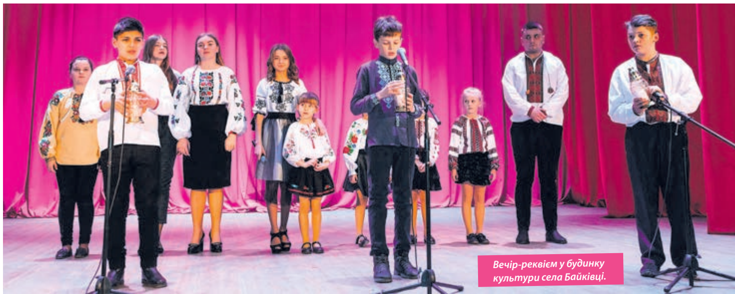
Вечір-реквієм у будинку культури села Байківці.

— Нам зараз тут, у тилу, добре. Ми у теплі, ми ситі... І тому ми часто забуваємо, що зараз на сході наші захисники під кулями, що вони про тепло і їжу думають лише у хвилини, коли стихають гармати. Але вони не відступають, бо пам'ятають, що за їхніми спинами — сім'ї, діти, всі