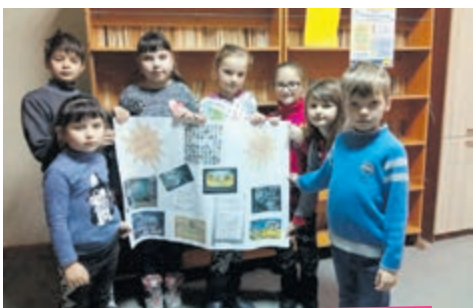
Захід у бібліотеці-філії с. Байківці