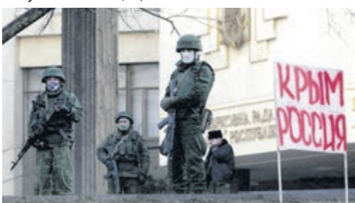
Особи без знаків розрізнення на позиціях біля будівлі Верховної Ради АРК.

Лідер кримських татар Рефат Чубаров згодом згадував: «Ми розійшлися, будучи впевненими, що врятували Крим, себе і Україну. Я її подумати не міг, що станеться».