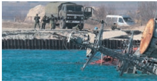
Російський затоплений корабель блокує вихід українських суден з озера Донузлав.

1 березня 2014 року Рада Федерації Росії підтримала звернення президента Путіна про дозвіл введення російських військ в Україну. Своєю чергою, РНБО України через агресію Росії ухвалила рішення привести Збройні сили України у повну бойову готовність.