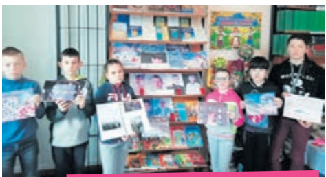
Виставка і захід в бібліотеці-філії с. Шляхтинці.