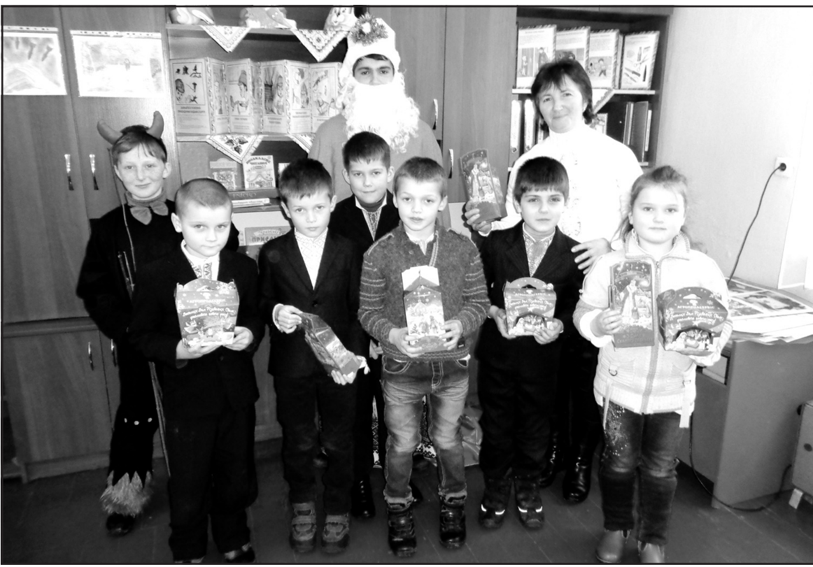
18 грудня до учнів Байковецької ЗОШ І-ІІ ст. з подарунками завітав Святий Миколай.