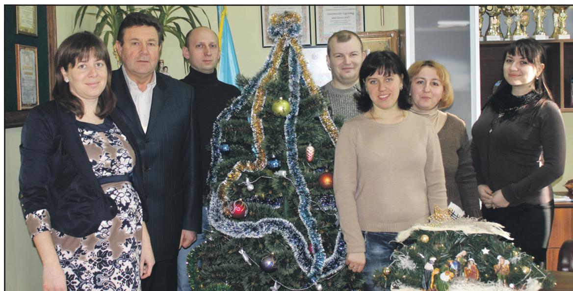
Колектив Байковецької сільської ради біля новорічної ялинки.

вецької сільської ради перенесені на 2015-ий. Не вдалося розпочати будівельні роботи на території футбольного міні-поля, оскільки є проблеми з проектною документацією. Не вдалося освітити вулиці Корольова і Степову – хотіли встановити освітлювальні прилади, які працюватимуть на сонячних батареях. Однак не сподівалися на таку високу ціну за проектну документацію – 300 тис. грн. лише на одну з вулиць. Втім, робота у цьому напрямку буде продовжена у 2015 році. Також не вдалося замінити систему опалення адміністративного приміщення сільської ради на твердопаливний котли. Не розпочали роботи щодо каналізування масиву Гаї Ходорівські.