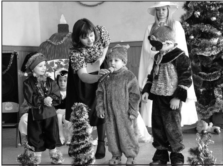
Під час новорічних забав малюки перетворилися у казкових персонажів.

Діти зустріли Зимув-чарівницю, яка привітала учасників і гостей свята з Новим роком. Разом зі Сніговою Бабою, роль якої ви-