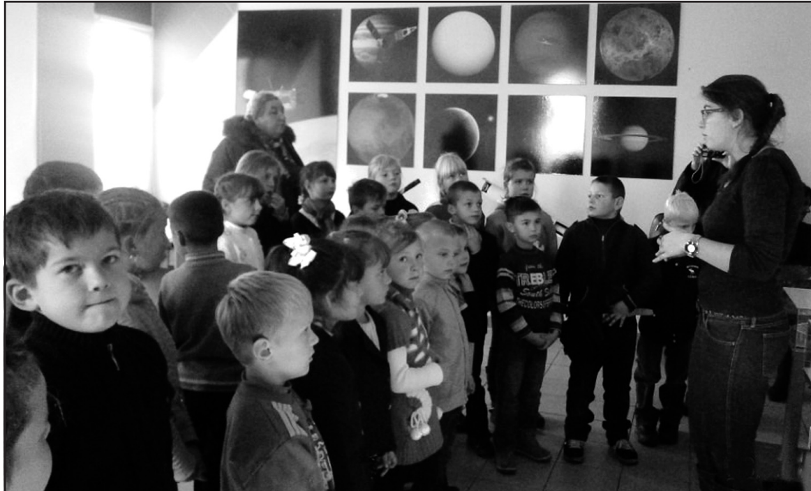
Школярі та вчителі Байковецької ЗОШ І-ІІ ст. під час експерсії у Тернопільському планетарії.