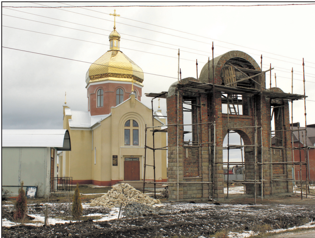
На початку вересня 2014 року під опікою байківчанина Любомира Скоренького на території церкви Пресвятої Євхаристії на масиві Русанівка в Байківцях розпочали будівництво дзвіниці.