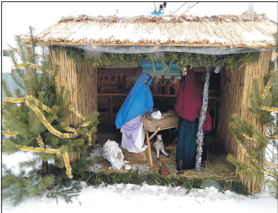
Під патронатом дирекції будинку культури с. Байківці у січні 2014 року впроваджено традицію встановлення різдвяної шопки поблизу церкви святої Параскеви Сербської. Про встановлення та декорування шопки подбала молодь села.