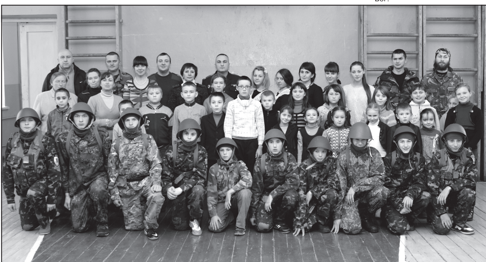
Учасники акції “Миколай для солдата” у Довжанківській ЗОШ I-III ст.

Колектив територіального центру соціального обслуговування (надання соціальних послуг) висловлює щирі співчуття колишньому директору територіального центру Марії Йосипівні Романюк з с. Великі Гаї з приводу тяжкої і неоправної втрати — смерті батька .