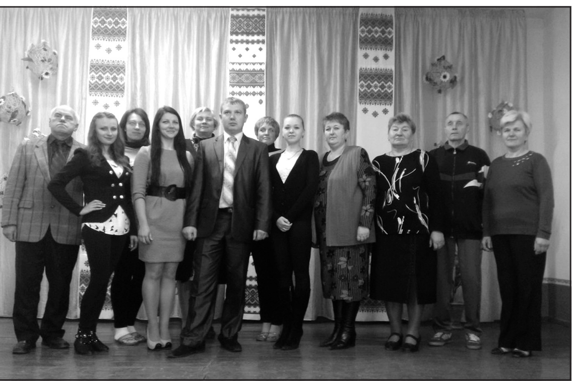
Педагогічний колектив НВК “Дичківська ЗОШ I-II ступенів – ДНЗ”.

Бажаємо Вам сонця на життєвій ниві І вірних друзів завжди на путі, Хай усе, що потрібно людині, Супутником буде у Вашому житті.