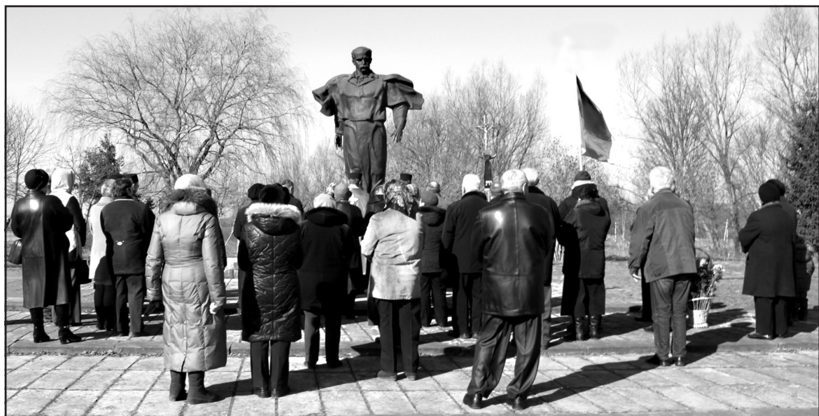
Урочистості з нагоди відзначення 201-ої річниці від дня народження Тараса Шевченка у смт Велика Березовиця розпочалися молитвою біля пам'ятника Кобзарю.

“А буде син, і буде мати, і будуть люди на землі...”