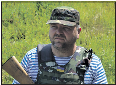
Борис Гуменюк: "Коли говорять гармати, музи не мовчать".