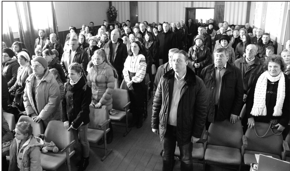
Учасники урочистої програми “Лине крізь століття Кобзареве слово” у будинку культури смт Велика Березовиця.

Більше фото про подію дивіться на сторінці “Подільське слово” у соцмережі Facebook.