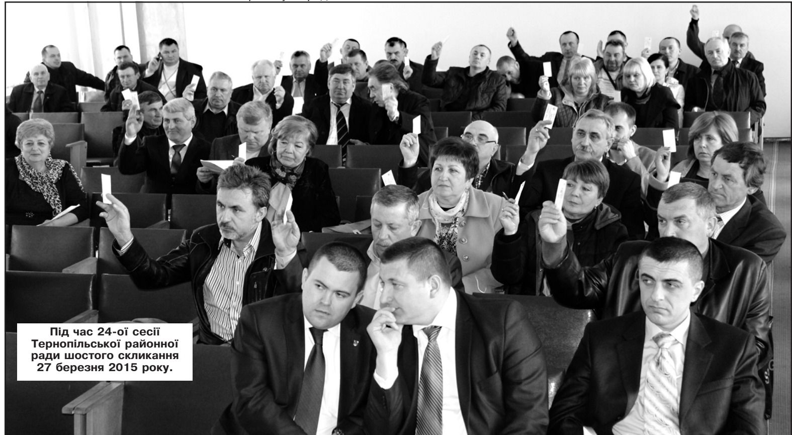
Під час 24-ої сесії Тернопільської районної ради шостого скликання 27 березня 2015 року.

На сесії затверджено проект землеустрою щодо зміни меж с. Великі Гаї на території Великогаївської сільської ради, відповідно до якого вирішено змінити межі Великих Гаїв, додатково включивши земельні ділянки площею 737,55 га. Депутати, взявши до відома інформацію голови тимчасової контрольної комісії Богдана Яценка, вирішили звернутися до Головного управління Держкомзему у Тернопільській області з проханням виділити земельну частку (пай) на території Довжанківської сільської ради за межами населеного пункту багатодітній сім'ї Надії Кушнір. Вирішено відмовити в укладенні угоди на передачу з районного бюджету до міського бюджету м. Тернополя 759 тис. гривень на забезпечення у 2015 році часткового фінансування утримання з міського бюджету м. Тернополя державного закладу "Відділкова клінічна лікарня станції Тернопіль державного територіального галузевого об'єднання "Львівська залізниця" м. Тернопіль". Депутати Тернопільської районної ради прийняли і направили звернення Президенту України Петру Порошенку і голові Верховної Ради України Володимирі Гройсману, в якому засудили окупацію Криму і частини Донбасу і визнали Росію країною-агресором.