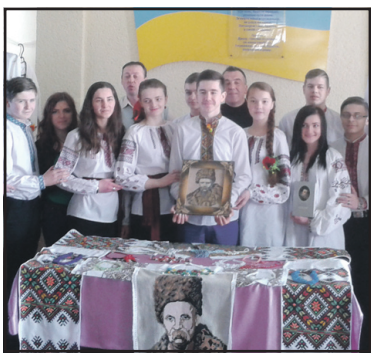
Підсумки районного огляду-конкурсу читців, присвяченого 201-й річниці від дня народження Тараса Шевченка.