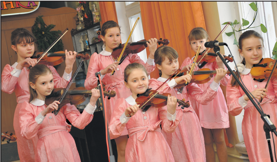
Ансамбль скрипалів дитячої хорової школи “Зоринка”. Квітень 2013 року.