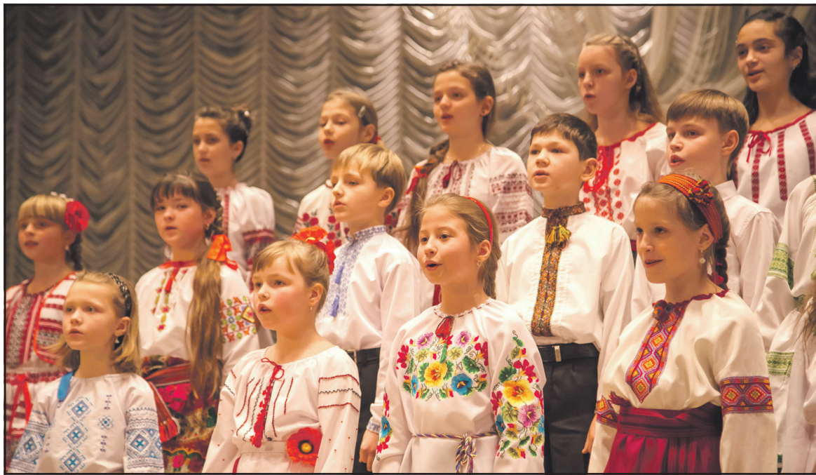
Вихованці дитячої хорової школи “Зоринка” на урочистому концерті з нагоди випуску школи в Тернопільській обласній філармонії. Травень 2014 року.