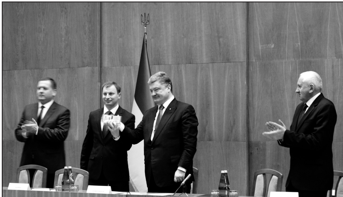
Президент України Петро Порошенко представив господарському активу Тернопільщини нового голову Тернопільської ОДА Степана Барну.

— Я особисто знаю Степана Степановича ще з часів Помаранчевої революції, як людину з якісною освітою, як патріота, який готовий працювати у моєму режимі — 24 години на добу, — зазначив Петро Порошенко. — Головне завдання сьогодні для Тернопільщини таке ж, як і будь-якого іншого регіону України: безпека і оборона суспільства в межах добросовісного проведення всіх етапів мобілізації. І хоч, мобілізаційний план України враховує особливості Тернопільщини, коли значна кількість чоловічого населення перебуває на заробітках за кордоном, на жаль, Тернопільщина, посідає перше місце в Україні за кількістю