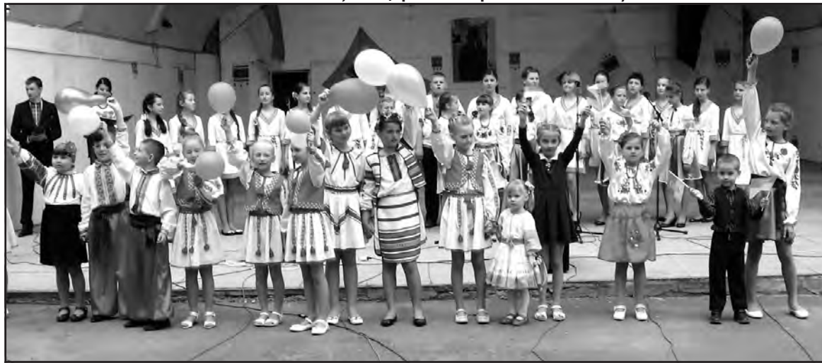
Учасники маминого свята у Великих Гаях — вихованці навчального дошкільного закладу “Країна дитинства” с. Великі Гаї та учні Великогаївської ЗОШ I-III ст.