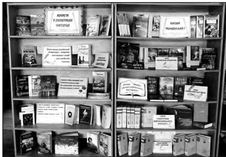
Книжкова виставка у центральній районній бібліотеці в смт Великі Бірки.

Література на виставці розміщена у 4 розділах. Перший розділ “Нова хвиля української літератури — дзеркало сьогодення і скарб для майбутніх поколінь”, представляє книги володарів премії “Коронація слова”. Тут користувачі можуть познайомитися з такими виданнями, як Володимира Лиса “Маска”, Володимира Лиса “Століття Якова”, Люко Дашвар “Битіє. Макар” у 2-х книгах, Жанни Куяви “Дерево, що росте в мені”. Другий розділ “Гірко і биль туманяє око, спитати хочеться мені: це розрахунок чий жорстокий зіткнув народи у війні” знайомить відвідувачів із виданнями героїко-патріотичної тематики та художньою літературою, яка присвячена подіям Другої світової війни.