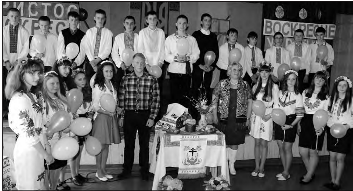
Восьмикласники Почапинської ЗОШ І-ІІІ ст. та їх наставники під час виховного заходу “Христос воскрес! Воскресне Україна”.

Сьогодні наш народ та суспільство можна порівняти з учнями Ісуса Христа, що знову переживають втрату надії, розчарування та безсилля, споглядаючи на свого зневаженого та розп'ятого Учителя. Ми сподівалися на відродження вільної держави, а натомість так часто зазнаємо гіркоти розчарувань та досвідчуємо крах власних ілюзій.