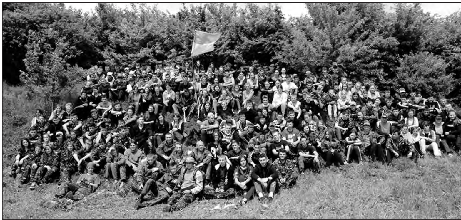
Учасники обласної теренової гри „Легенда УПА” на території дитячого табору „Орлятко” в місті Теробовлі, травень 2015 року.

Першими у боротьбу ввійшли туристи та пейнтболісти. Якщо туристська смуга перешкод для наших туристів із технічного боку не була складною, то довжина таких етапів, як „навісна переправа через яр” (22 метри), переправа по мотузці з поруччями через яр” (20 метрів) вимагала доброї фізичної підготовки. В цьому виді змагань наші туристи всього кілька секундми поступилися третій команді і зайняли четверте місце. Паралельно у боротьбу ввійшла команда з пейнтболу. Впевнено здолавши один за одним суперників зі Зборівського, Шумського та Теробовлянського районів, лозівчани вийшли у фінал, де зустрілися зі своїм постійним суперником по