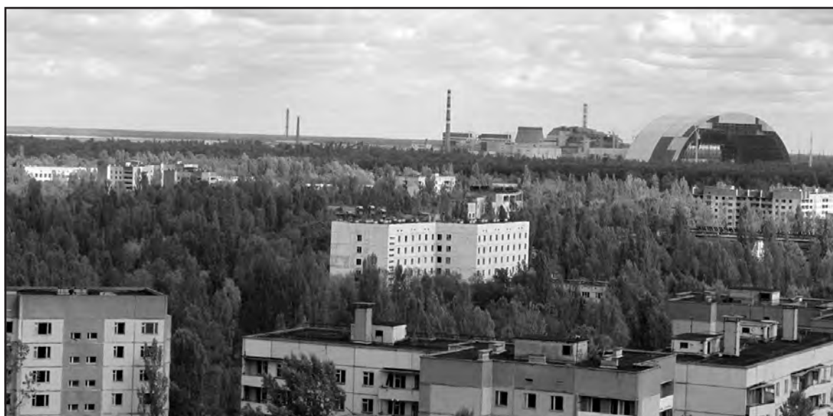
Добротні житлові будинки у м. Прип'ять поглинає природа. Масивна округла споруда на фото праворуч – новий захисний саркофаг для накриття четвертого аварійного реактора.

P.S. Якщо взяти з зони відчуження який-небудь сувенір напам'ять, можна вирішити своє житлове питання на 5 років – саме такий термін позбавлення волі згідно з чинним законодавством України.