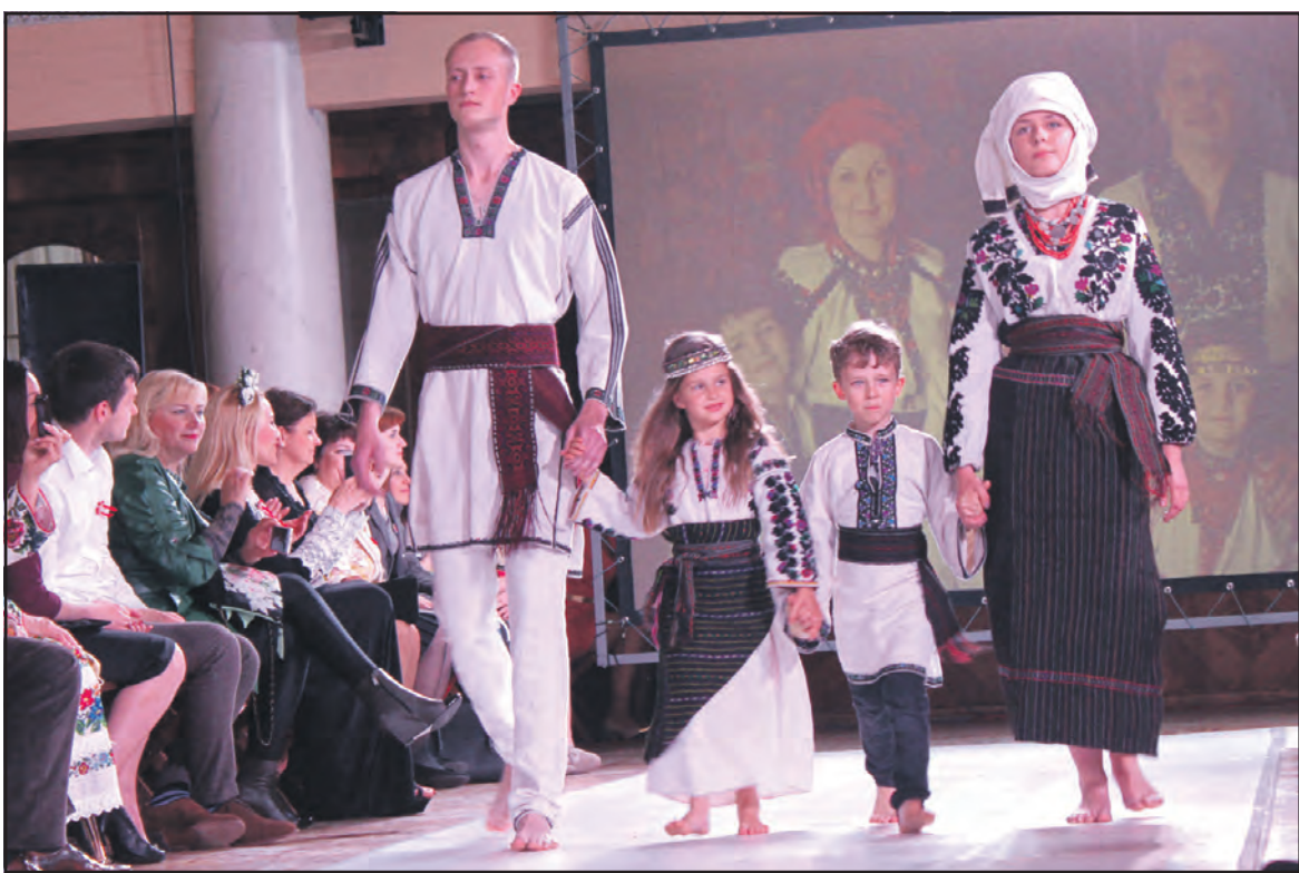
“Українська деталь” (особливо вишивка та національний убір) входить у світову композицію моди швидкими темпами.