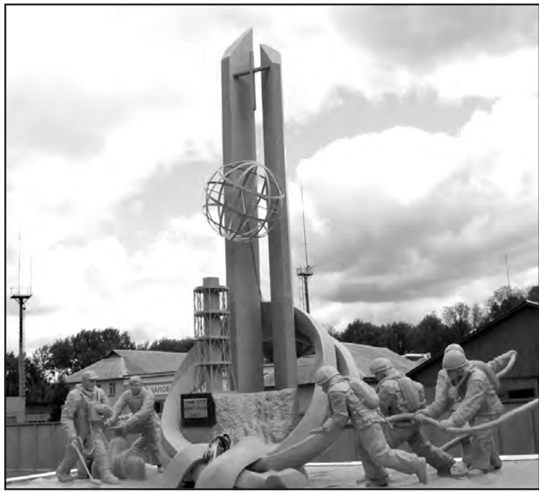
Пам'ятник ліквідаторам аварії на ЧАЕС у м. Чорнобиль, який пожежники і працівники Чорнобильської зони відчуження виготовили за власний кошт.

вннього опромінення. На сайті Чорнобиля є опція, яка допомагає перевірити рівень радіації в онлайн режимі. В межах кілометра від знаменитого реактора є ідалія, якою користуються всі відвідувачі.