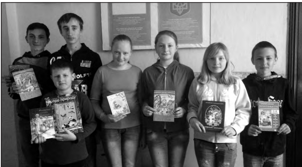
Учні Ігровицької ЗОШ І-ІІ ст. зібрали книги для дітей Донбасу.