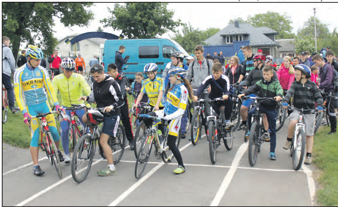
Учасники велофестивалю "Ровер" на стадіоні села Великі Гаї. 24 травня 2015 року.