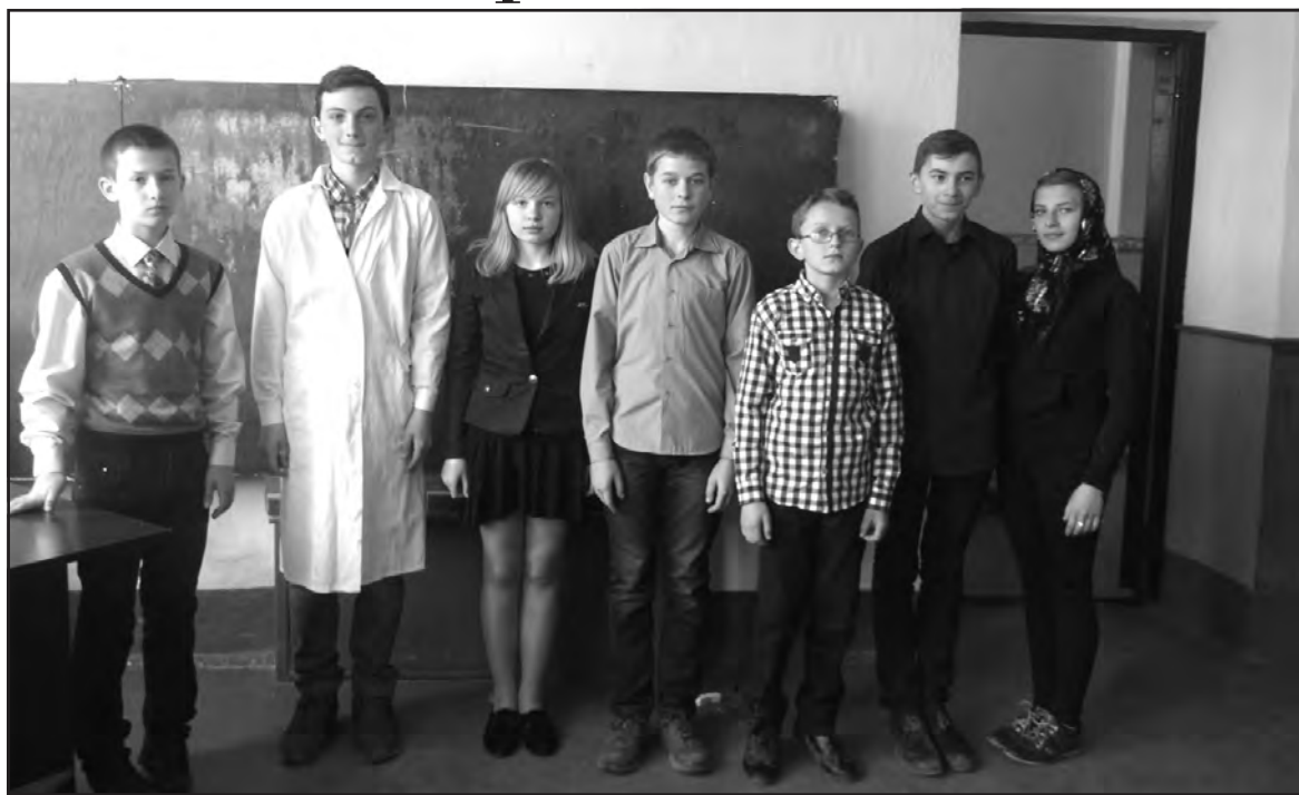
Старшокласники Ігровицької ЗОШ І-ІІ ст. під час лінійки пам'яті “Дзвони Чорнобиля”.

В Ігровицькій школі відбулася лінійка пам'яті “Дзвони Чорнобиля”, приурочена 29-тій річниці Чорнобильської трагедії. Учні 7 класу нагадали усім про страшну ніч 26 квітня 1986 року на Прип'яті, в містечку атомників Чорнобиль.