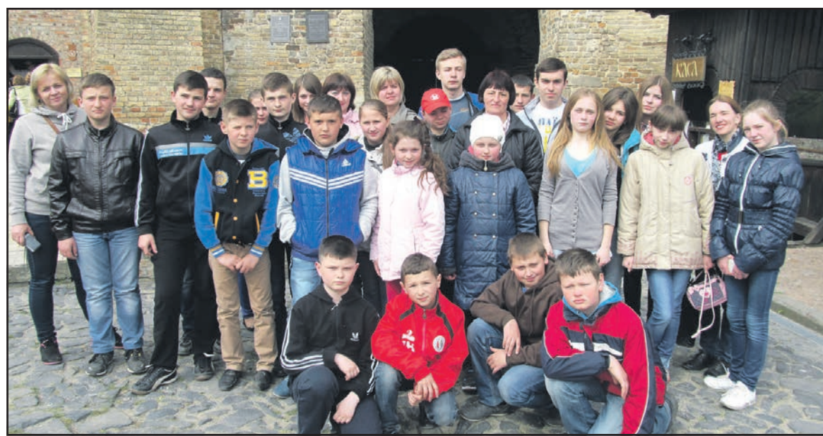
Школярі та педагоги Ангелівської ЗОШ I-III ст. на території Луцького замку у Волинській області.

Ось нарешті ми стоїмо перед В'їзною вежею Луцького замку. Це гордий свідок історії міста, який витривав чимало пожеж, нападів та негод. Луцький замок складався із двох частин. Це Верхній замок, збережений у добром стані, та Нижній, від якого залишилися лише деякі фрагменти стін. Варто зазначити, Луцький замок здобув перше місце у всеукраїнському конкурсі “Сім чудес України: замки, палаці, фортеці” у номінації “замки”. Історія мурованого замку нараховує понад 600 років. Для відвідувачів відчинені дві вежі – В'їзна, на яку ми піднялися з екскурсивним будинком, та Владича, де розташований музей дзвонів. Окрім того, у при-