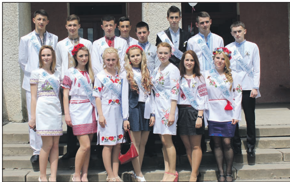
Випускники 11-Б класу НВК "Великобірківська ЗОШ I-III ст.-гімназія ім. Степана Балея".