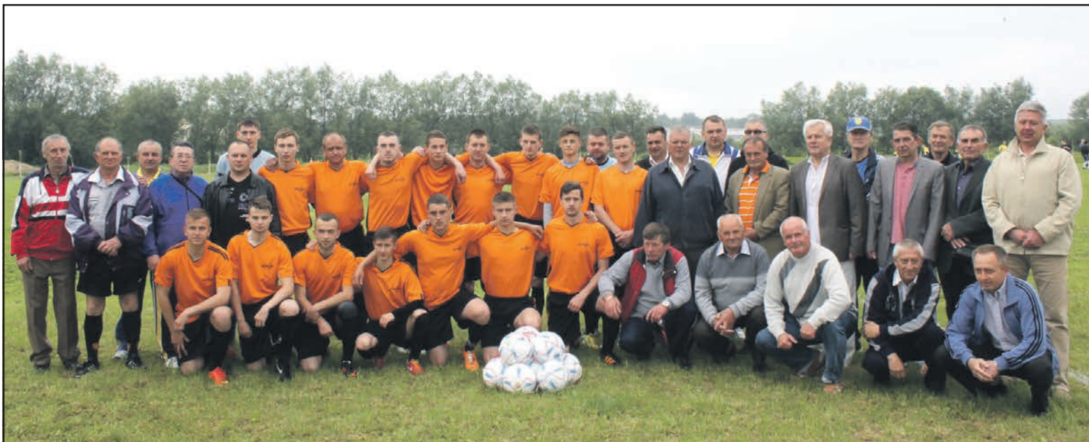
Команда селища Велика Березовиця з учасниками освячення футбольного поля перед матчем четвертого туру чемпіонату Тернопільського району з футболу.

больним полем спортивний майданчик із синтетичним покриттям, трибуни, вбиральню. Сподіваюся, обласна і районна влада нам у цьому допоможуть. Хочемо, щоб молодь мала де займатися спортом. Прикро, звичайно, що наша команда у першому матчі на новому полі поступилася хлопцям із Великих Гаїв із рахунком 0:1. Однак я впевнений, що перемоги великоберезовицького футбольного колективу ще попереду.