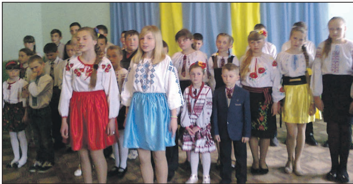
Учні Ігровицької ЗОШ І-ІІ ст. під час відзначення Дня матері.

Учні першого класу читали вірші своїм матерям і співали частівки. Учні 2-3 класів виконували пісні. Учні 5-9 класів присвячували своїм матерям поезії і пісні. Учасники танцювального ансамблю “Яблуневий цвіт” виконали два українських таночки. Ведучими на святі були учениці 7 класу Тетяна Франківська і Анастасія