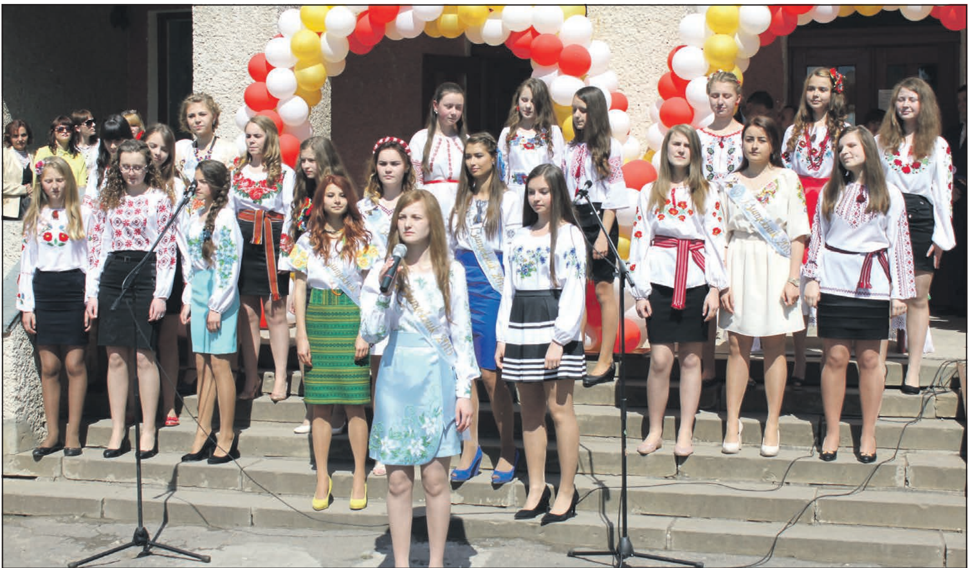
Учасники старшої групи шкільного ансамблю “Калиновий цвіт” на святі останнього дзвоника в НВК “Великобіроківська ЗОШ I-III ступенів-гімназія ім. Степана Балея”. 29 травня 2015 року.