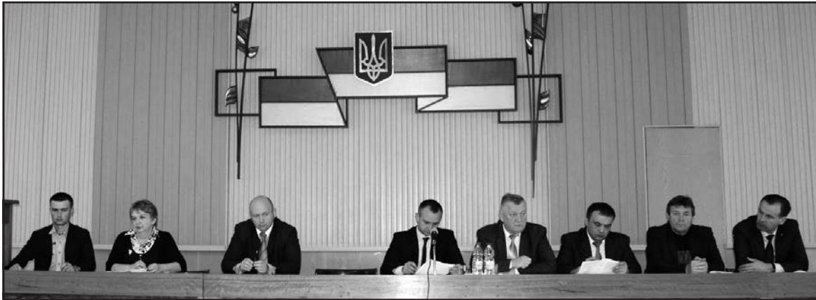
Під час колегії Тернопільської райдержадміністрації, 28 травня 2015 р.