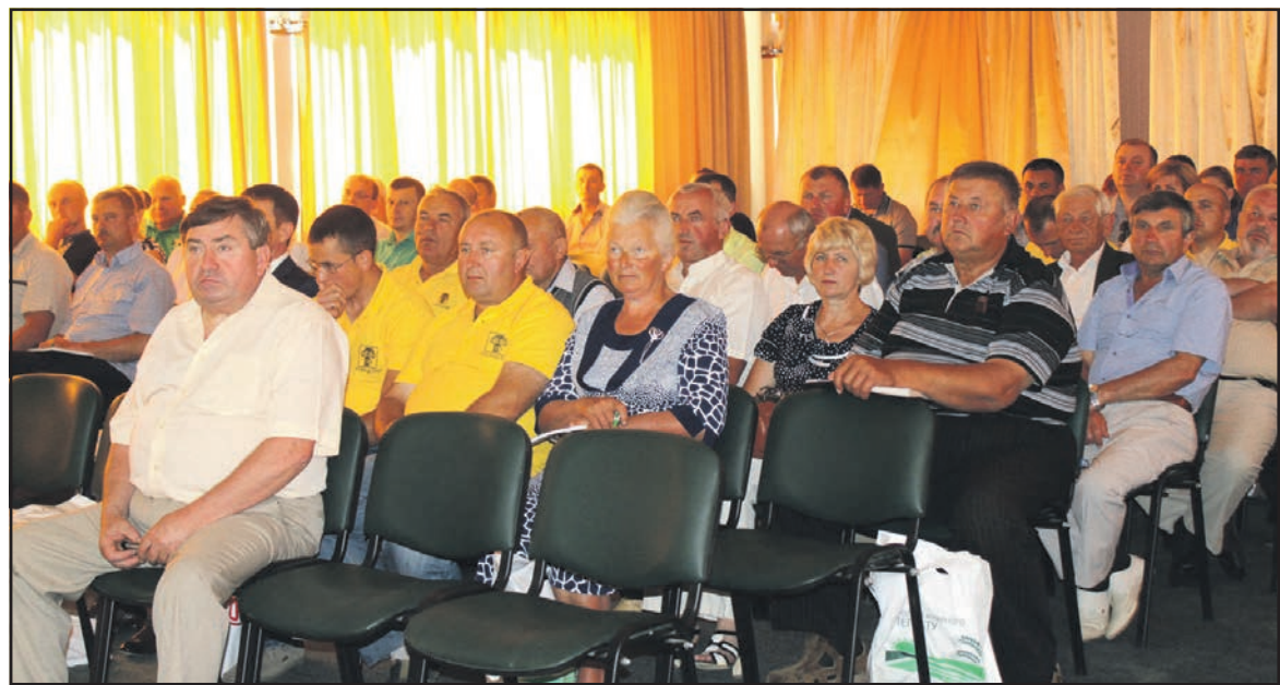
Учасники науково-практичного семінару в конференцзалі ПАП “Агропродсервіс”.