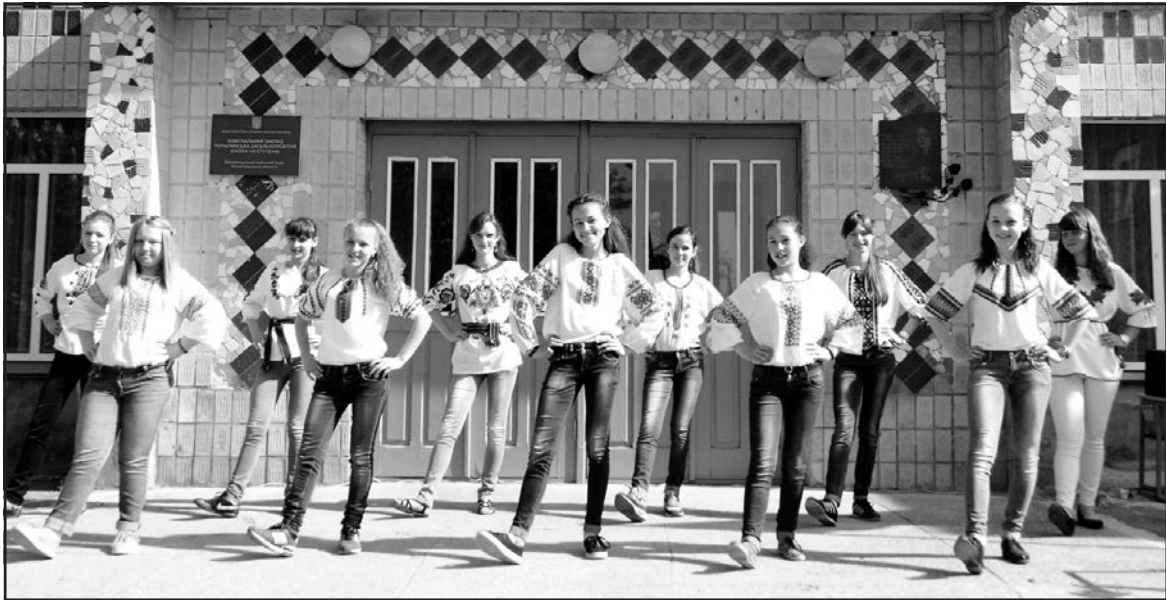
Учні 8 класу Почапінської ЗОШ І-ІІІ ст. виконують танець "Козачок".

На завершення усі разом скандували: "Слава Україні! Героям слава!"