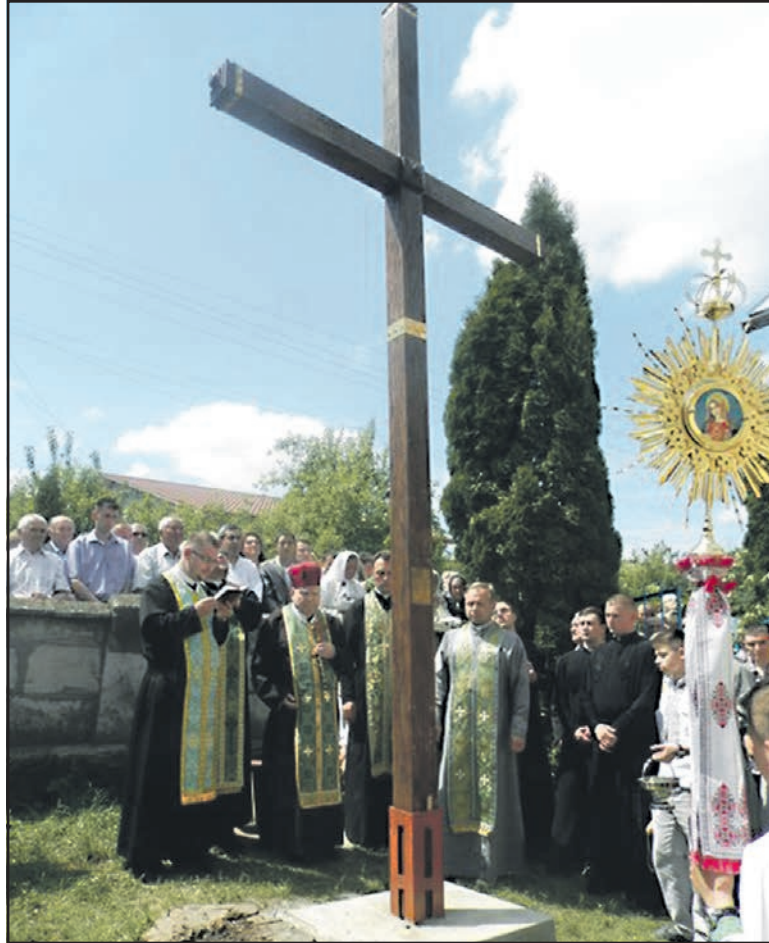
Встановлення місійного хреста на подвір'ї церкви св. Архангела Михайла у с. Курники.