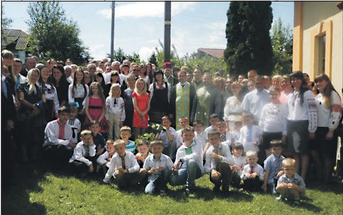
Громада Курників та гості села під час місії.

Бережи Вас доленька-доля Від образ, від лукавства і бід, Хай зійде Всевишнього воля — Життя на світі хоча б до ста літ!