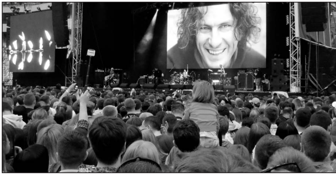
Концерт пам'яті лідера гурту “Скрябін” Андрія Кузьменка на “Львів-Арені” 21 червня ц.р.

“Не мовчи за мене в мій мікрофон...” (Кузьма “Скрябін”).