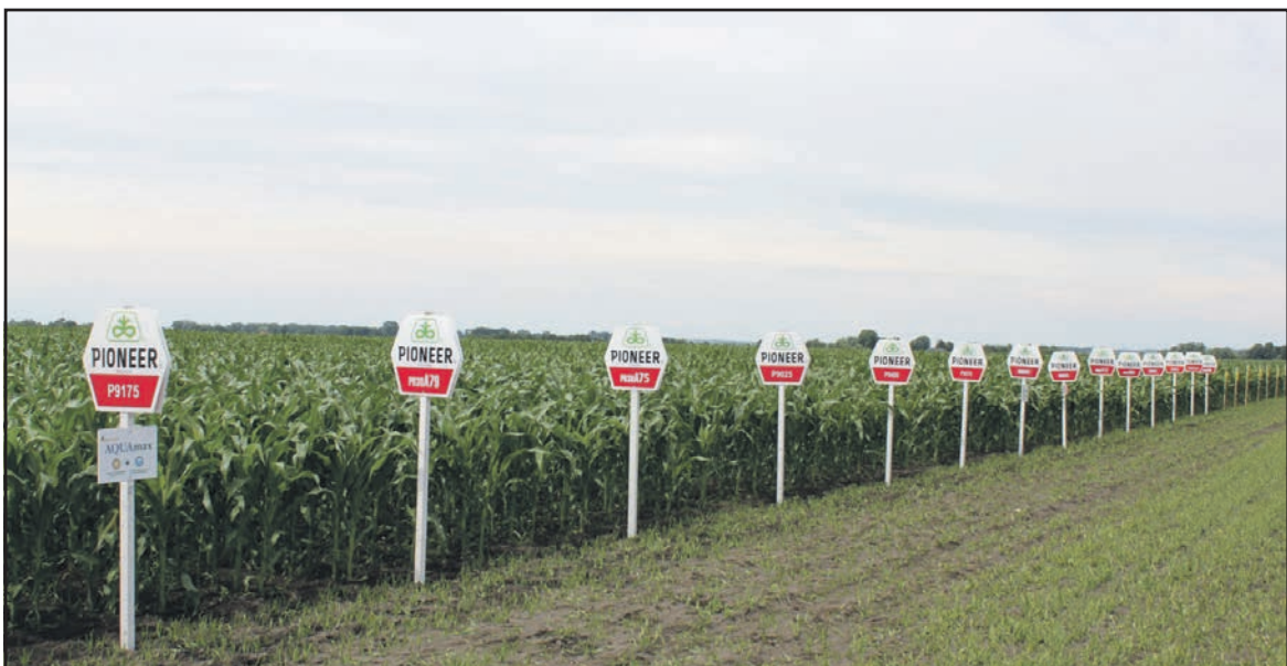
Вагома складова ТОВ “Дюпон Україна” — його підрозділ, світовий лідер у розробці і наданні сучасної генетики рослин фермерам в усьому світі — “Дюпон Піонер”.

ний контроль широкого спектру одно- і багаторічних бур'янів. На цій ділянці використано 15 г/га Еллай® Супер та 750 мл/га Абруста® , 0,75 л/га Аканто Плюс® у фазі початку виходу ячменю в трубку. Також “Дюпон” показав захист сої від бур'янів на прикладі суміші Хармоні® 8г/га та 2,3 л/га Базаграну® .