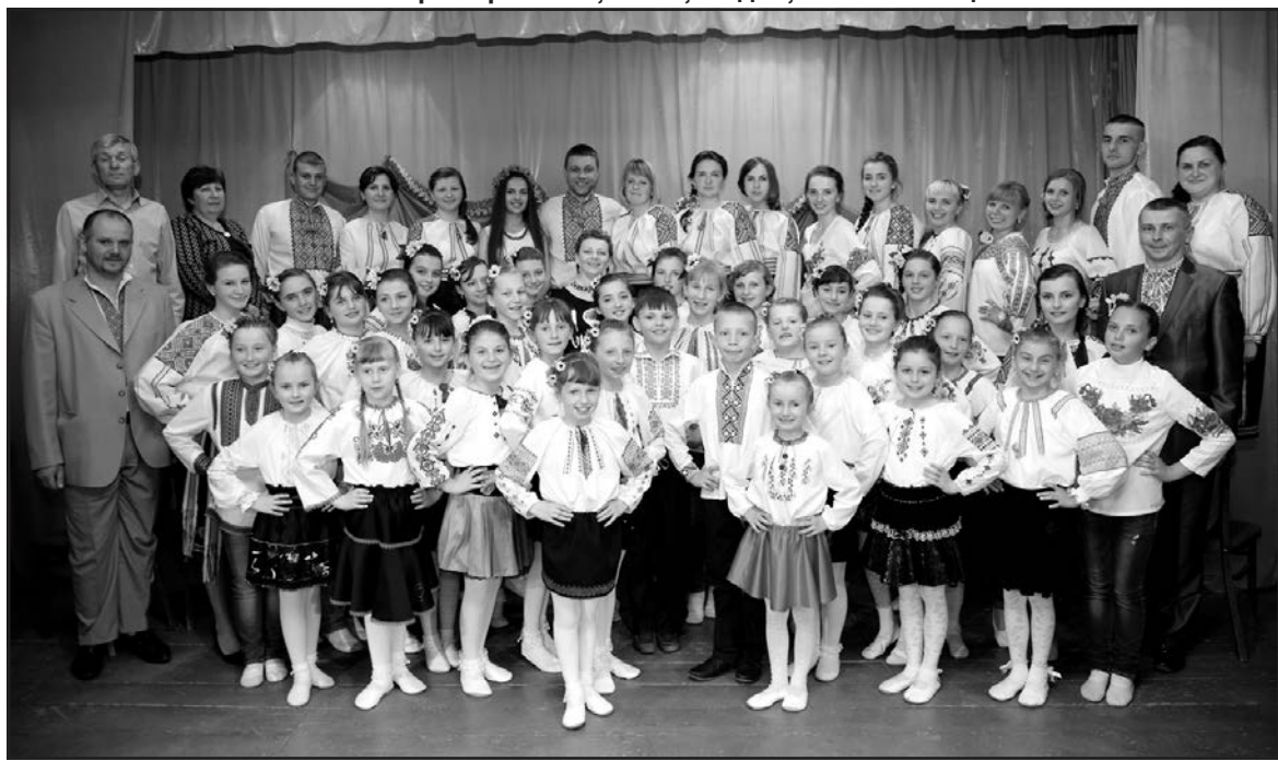
Учасники художньої самодіяльності с. Мишковичі під час урочистостей “Нема без кореня рослини, а нас, людей, без Батьківщини” у будинку культури с. Мишковичі, 10 травня 2015 року.