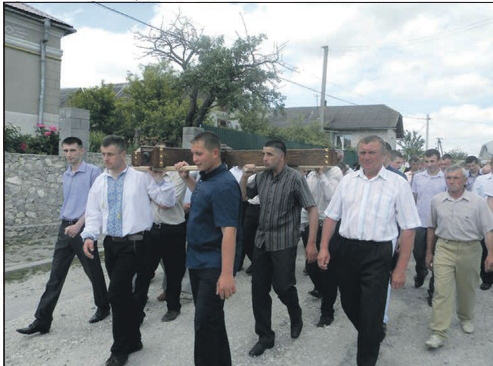
Вулицями села — з місійним хрестом.

участь у Службі Божій та приступили до святого причастя. Після літургії владика уділив повний відпуст усім тим, хто в часі місії приступив до святої тайни покаяння та прийняв святе причастя. Опісля було благословення. Спеціально для такої величної події у Курниках був виготовлений місійний хрест, орієнтована вага якого сягала 300 кілограмів. Чоловіки, які були присутні на місії, несли хрест до села і після цього, аби увіковічити цю подію, встановили його біля храму св. Архангела Ми-