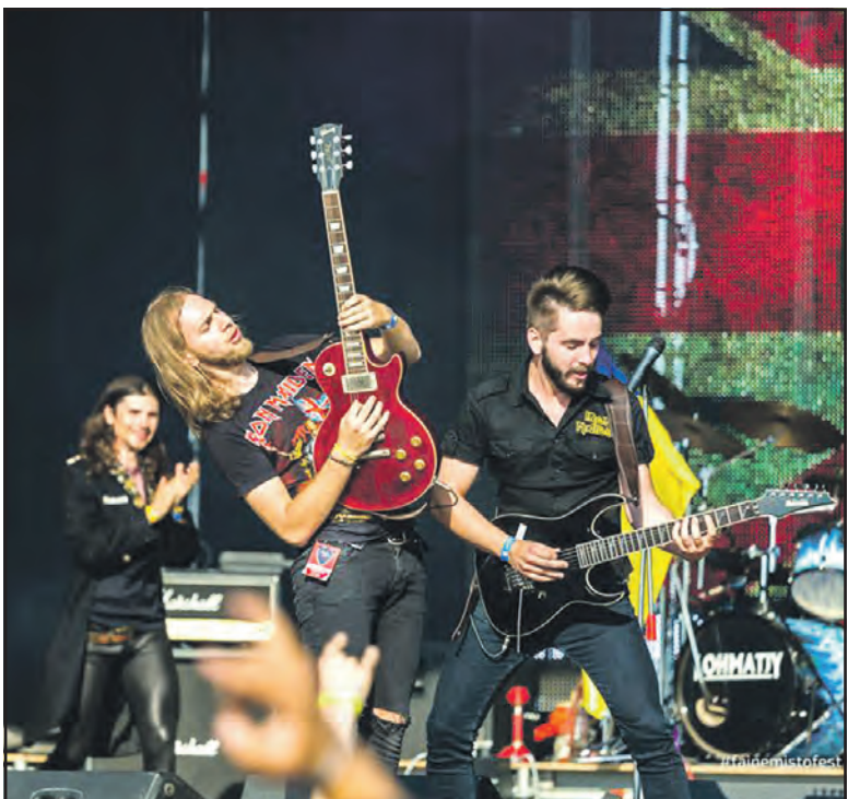
Під час фестивалю “Файне місто” на трьох сценах виступили понад 60 гуртів (окрім українських виконавців, були гурти з Білорусі, Швеції, Австрії, Польщі, Грузії, Росії).