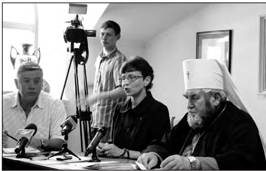
Архієпископ і митрополит Тернопільсько-Зборівський Василій Семенюк та учасники прес-конференції, 6 липня 2015 р.

Отець Орест Павлівський зазначив, що проща є унікальною в контексті особистісного ставлення людини до того, як вона її сприймає. "На мою думку, цього року на прощю має не йти хіба що той, хто або вмер, або це мама, яка годує