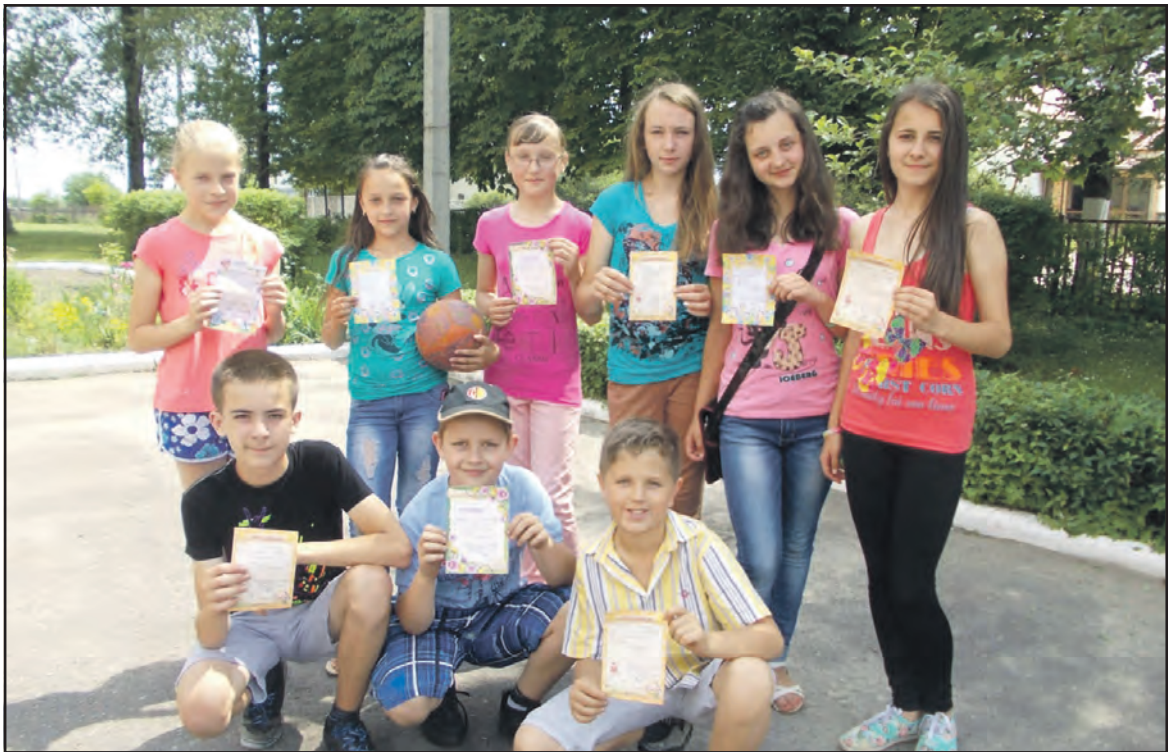
Найактивніші учасники пришкільного табору "Дивосвіт" у НВК "Великобірівська ЗОШ I-III ст.-гімназія імені С. Балаєв".