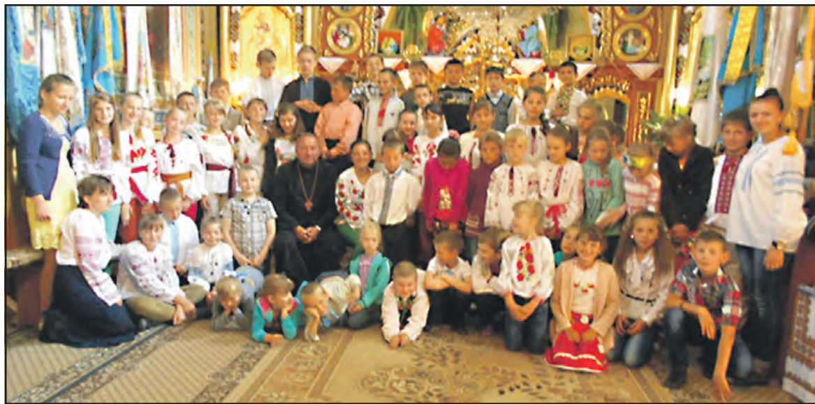
Учасники християнського табору "Веселі канікули з Богом" у церкві Різдва Івана Хрестителя.