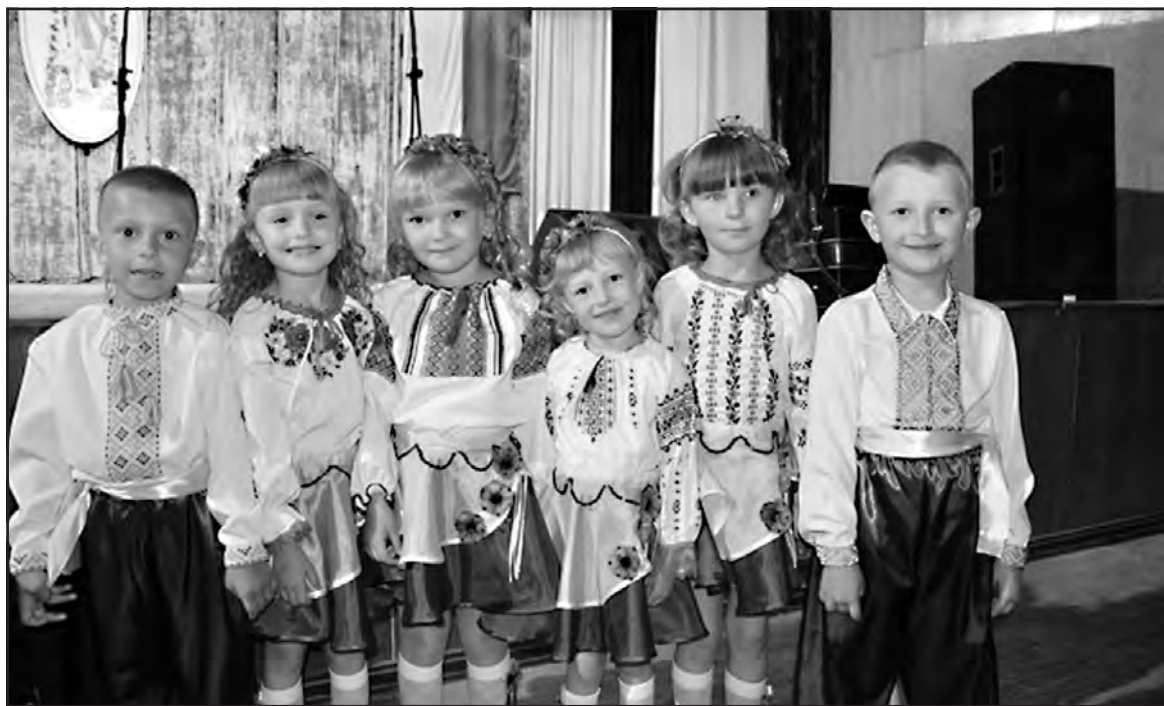
Вихованці Настасівського дитячого садка "Колосок" с. Настасів.