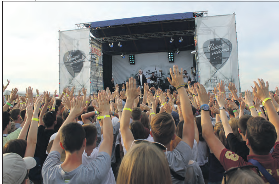
Під час виступу українського гурту “Vivienne Mort” на фестивалі “Файне місто”.