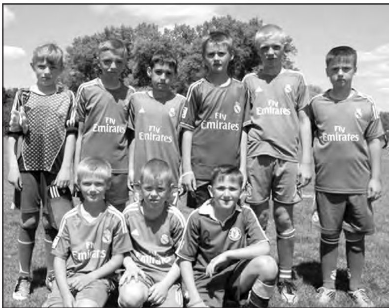
Учасники дитячої команди "Бескиди-Ю" с. Лозова.

Першими вийшли на футбольне поле команди "Урожай" і "Джерело". На іменний турнір, аби показати свої успіхи, завітала дитяча команда із Довжанки. Ця гра була цікавою і незабутньою, юні футболісти показали хорошу гру і командний дух. Але перемогли сильніші: завдяки гарячій підтримці великої кількості вболівальників господарі поля отримали впевнену перемогу. З рахунку 5:0 перемогла дитяча лозівська команда