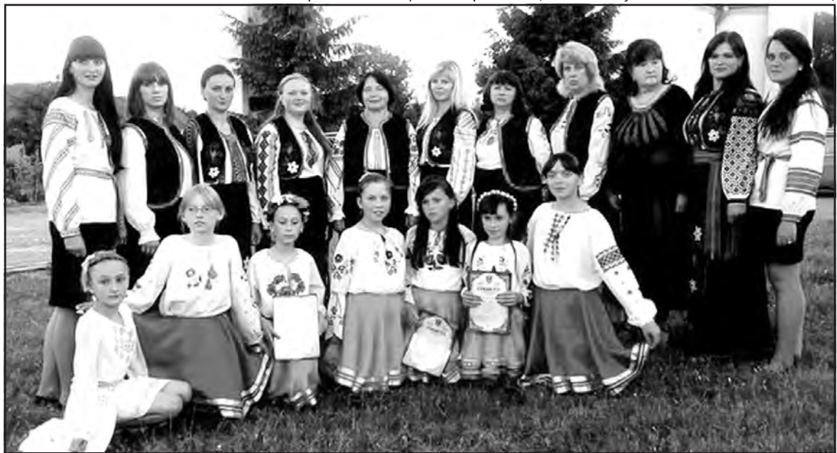
Учасники концерту в с. Лозова, приуроченого Дню села і Дню Конституції.