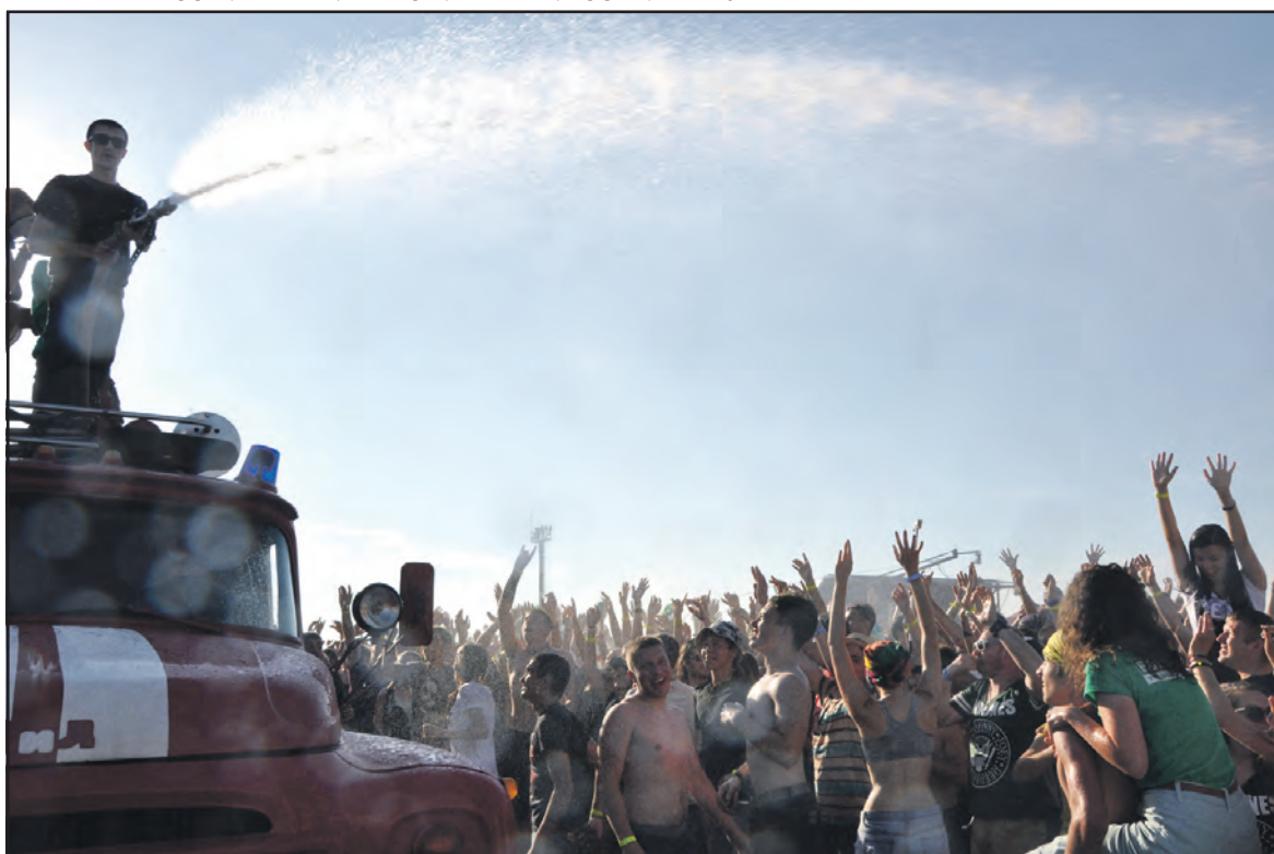
У неділю на територію фестивалю прибули рятувальники, хоча й не за запитом тривоги, а щоб “полити” з пожежних рукавів розпечених сонцем та танцями людей. Всі були в захваті!

було б звинувачувати організаторів у непрофесіоналізмі.