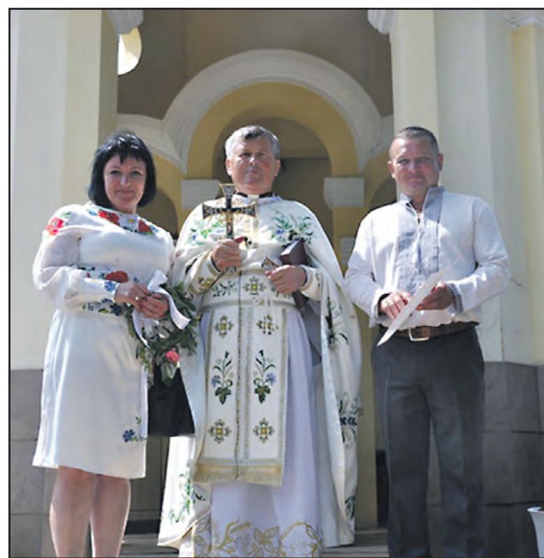
Подружжя Михайловичів та о. Володимир.