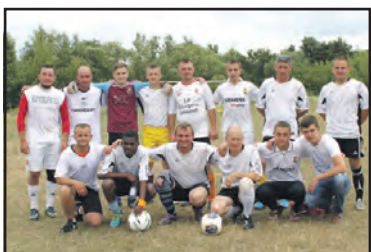
Футбольну честь команди "Жовтневе" захищають... африканці.

www.trrada.te.ua - веб-сторінка Тернопільської районної ради