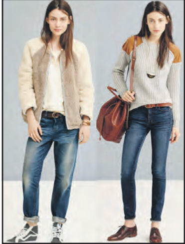
Про стильні і зручні джинси — у "Порадниці".

Для вас, шукачі роботи! Тернопільський міськрайонний центр зайнятості повідомляє, що 23 липня 2015 року о 12.00 год. у приміщенні ПАТ ТРЗ "ОРИОН" за адресою: м. Тернопіль, вул. 15 Квітня, 6 відбудеться День відкритих дверей.