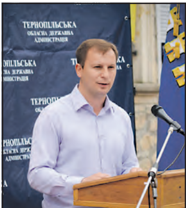
100 днів Степана Барни, або Презентація стратегії Тернопільської ОДА.

www.trrada.te.ua - веб-сторінка Тернопільської районної ради