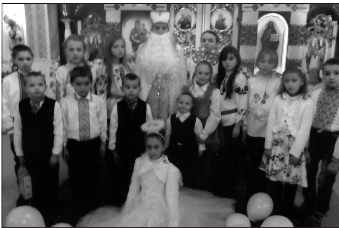
Свято Миколая у церкві святих апостолів Петра і Павла у с. Лозова.