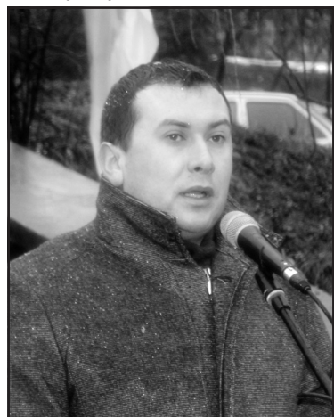
Народний депутат України Тарас Юрик: "Великий українець Ярослав Стецько, який боровся за те, щоб вирвати Україну з тенет московсько-більшовицької орди, розумів небезпеку російського ворога".

Ярослав Стецько палко відстоював право українського народу на вільну і незалежну державу.