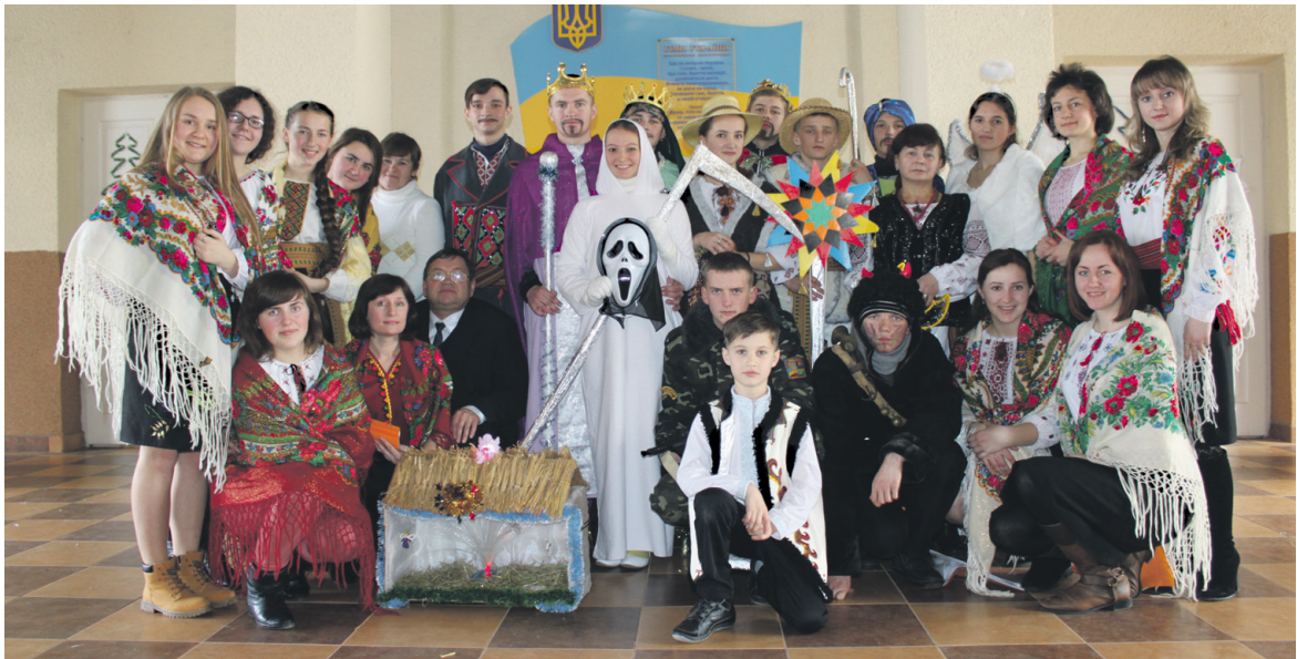
Ансамбль храму Вознесіння Господнього і вертеп будинку культури селища Велика Березовиця.