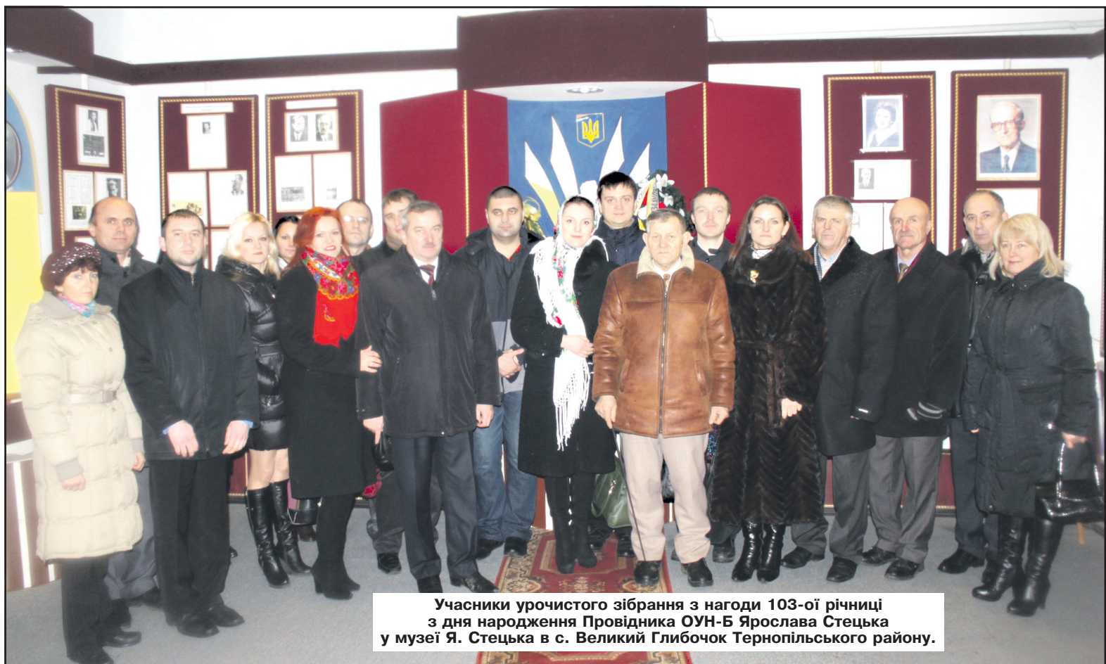
Учасники урочистого зібрання з нагоди 103-ої річниці з дня народження Провідника ОУН-Б Ярослава Стецька у музеї Я. Стецька в с. Великий Глибочок Тернопільського району.