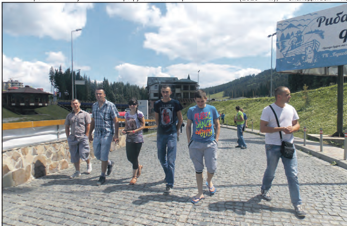
На території курортної бази "Буковель".

Карпати – унікальний край! Усім, хто збирається у відпустку або відпочити у вихідні, раджу відвідати Карпати. У щоденних клопотах та міській суєті виділіть час для власного здоров'я, будьте натхненні на незвичайні пригоди, які дає спілкування з живою природою, бо цієї гармонії так часто бракує у повсякденному житті. Мандруйте!