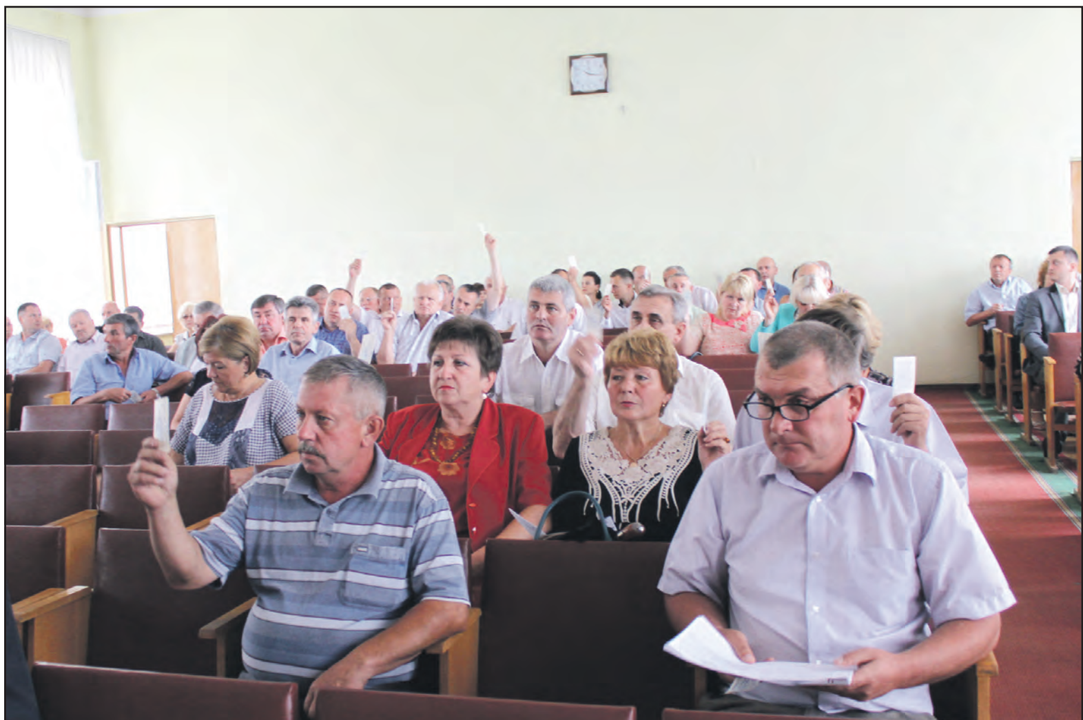
Депутати Тернопільської районної ради 6-го скликання у сесійній залі 29 липня 2015 року.