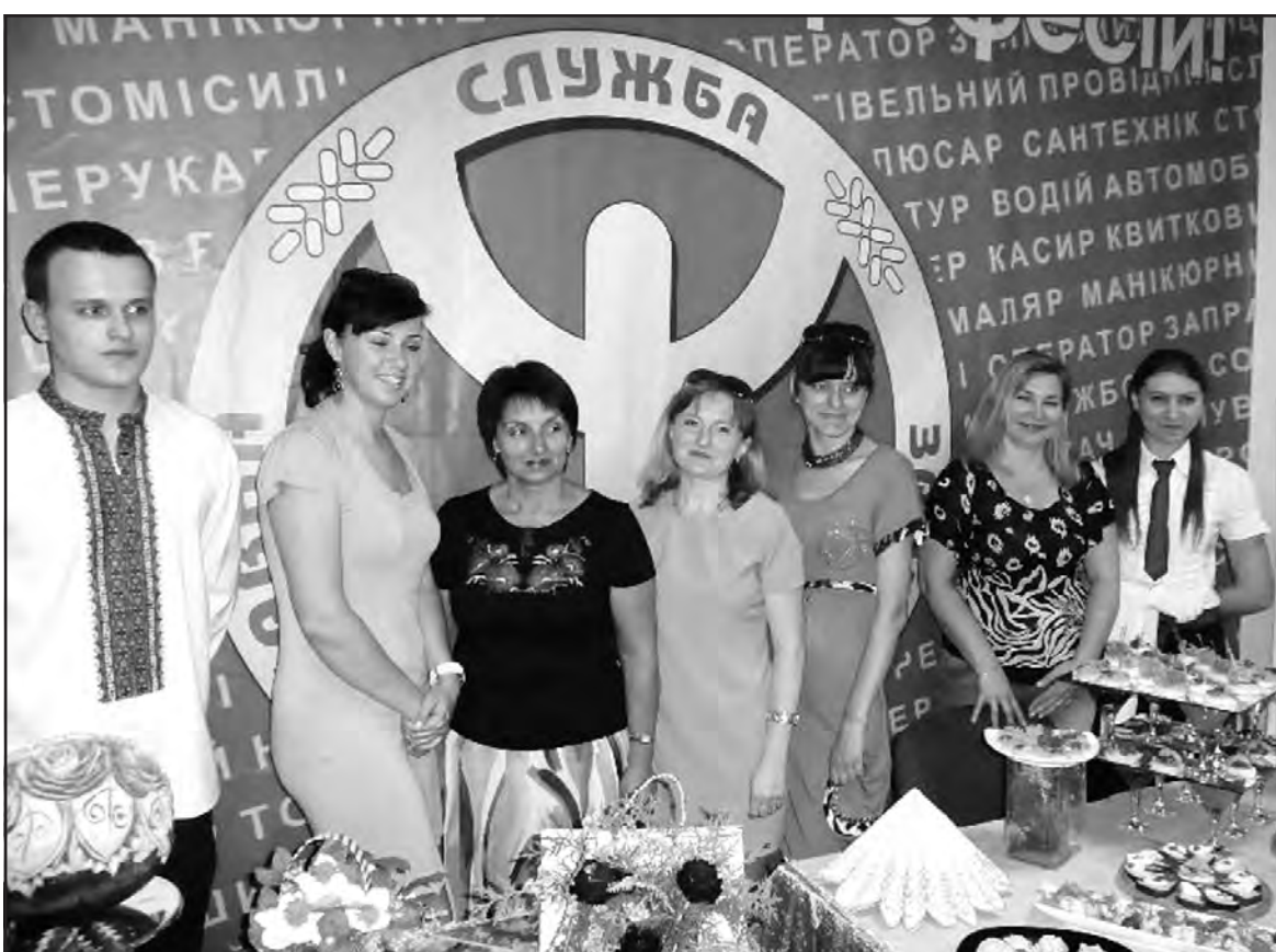
День відкритих дверей 17 липня ц.р. у Будинку праці в м. Тернополі.