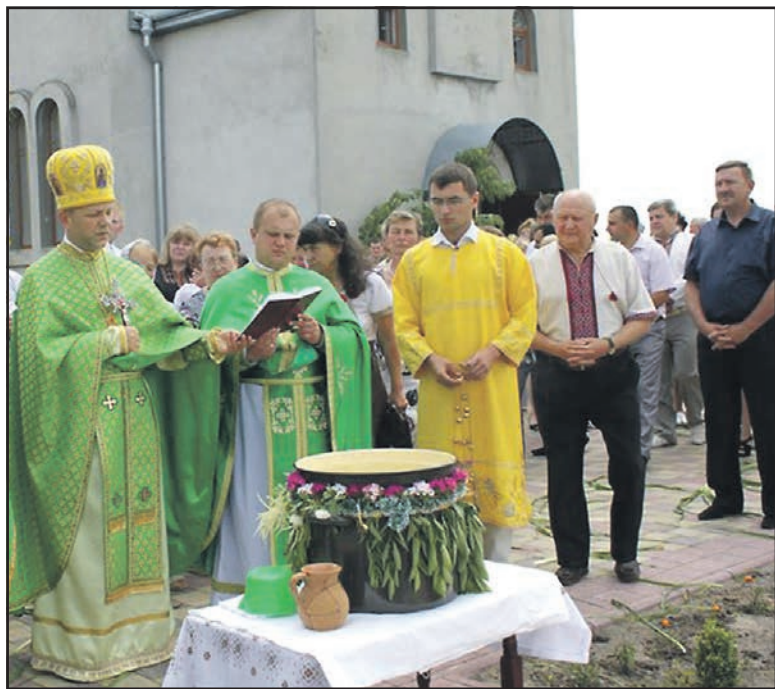
Під час освячення води біля храму Пресвятої Трійці у день престольного празника, 8 червня 2014 року.