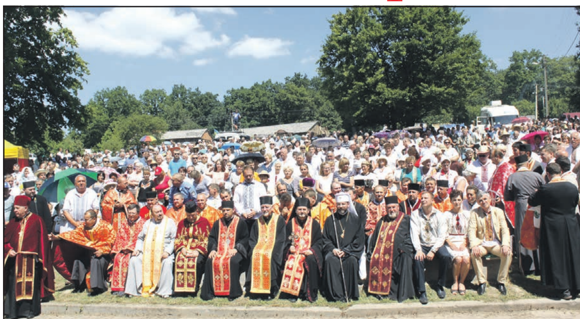
Серед священнослужителів та учасників фестивалю глава УГКЦ Блаженніший Святослав Шевчук, архієпископ і митрополит Тернопільсько-Зборівської єпархії УГКЦ Василь Семенюк, голова Тернопільської ОДА Степан Барна.

На шістнадцятий фестиваль "Дзвони Лемківщини" щіри лемки привезли чимало унікальних старовинних речей, які їм передали пра-