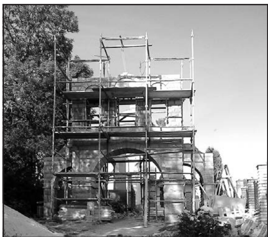
Будівництво дзвіниці церкви Різдва Пресвятої Богородиці у Смиківцях триває.

Наше правдиве село, як міцний осідок християнства, розташоване у мальовничій місцевості на берегах тихоплинної річки Гніздечна. Воно багате історичною минушиною і незламним патріотичним духом.