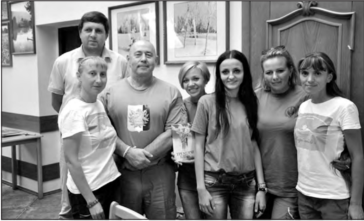
Учасники тренінгу для волонтерів "Співпраця волонтерів зі ЗМІ – про що варто і не варто інформувати. Як спілкуватися з пораненими, родинами загиблих, переселенцями, щоб не нашкодити" у прес-клубі газети "Вільне життя".