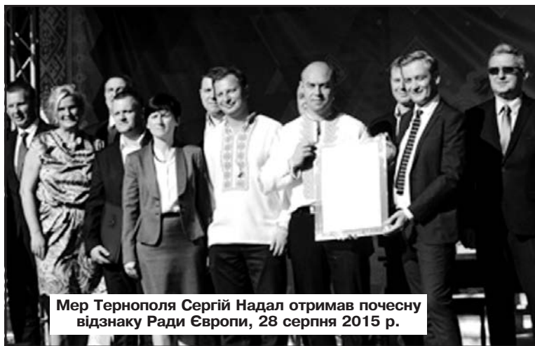
Мер Тернополя Сергій Надал отримав почесну відзнаку Ради Європи, 28 серпня 2015 р.

Паралельно агрохолдинг "МРІЯ" вже проводить посів озимого ріпаку та активну підготовку площ до осінньої посівної. Компанія продовжує закуповувати нову техніку, відновлюючи власний парк. Зокрема, вже придбано жатки для збирання соняшнику, на черзі підписання контрактів та отримання нових тракторів і самохідних обприскувачів.