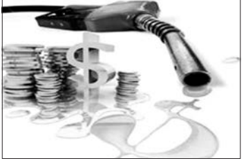
Тернопільська районна рада Тернопільська об'єднана державна податкова інспекція.

Їдете до родичів чи на відпочинок? Купуйте пальне в межах свого району та вимагайте чек. Знайте — акцизний податок залишається в бюджеті місцевої громади.