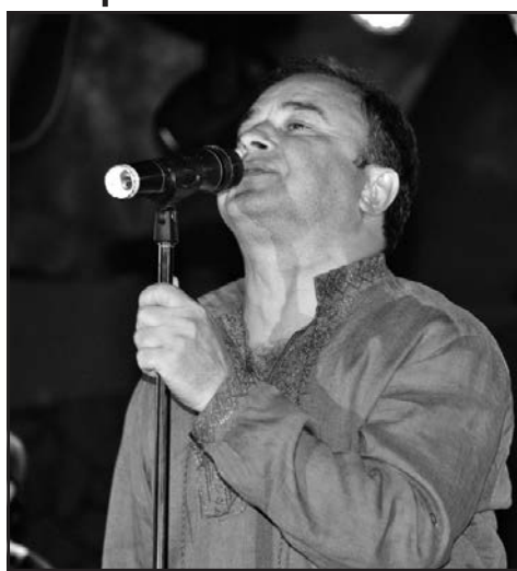
Заслужений артист України Віктор Павлік на Співочому полі в Тернополі, 28 серпня 2015 р.

Для тернополян заслужений артист України Віктор Павлік завжди асоціюватиметься із поп-групою "Анна-Марія", яка, по суті, й "винесла" його на вершину слави. І як тут не згадати майже легендарну пісню "Шикидим"... На початку 90-х Віктор Павлік та його група були переможцями практично всіх можливих конкурсів і фестивалів того часу в Україні і не