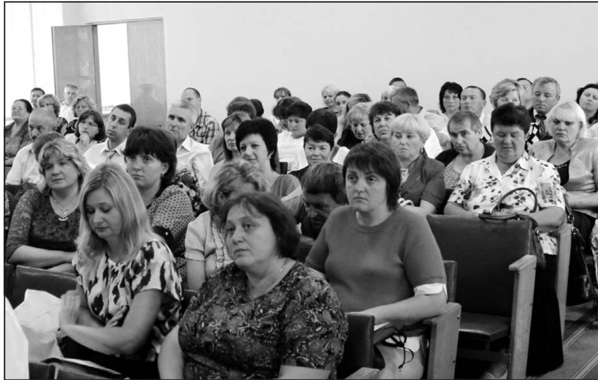
Учасники розширеної колегії відділу освіти Тернопільської РДА, 26 серпня 2015 р.