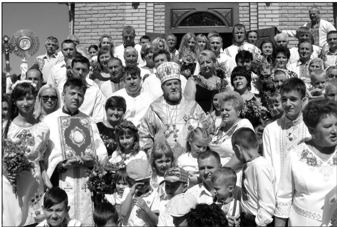
Архієпископ і Митрополит Тернопільсько-Зборівської єпархії УГКЦ кир Василій Семенюк серед парафіян церкви Преображення Господнього на масиві Гаї Чумакові у Байківцях та гостей свята.