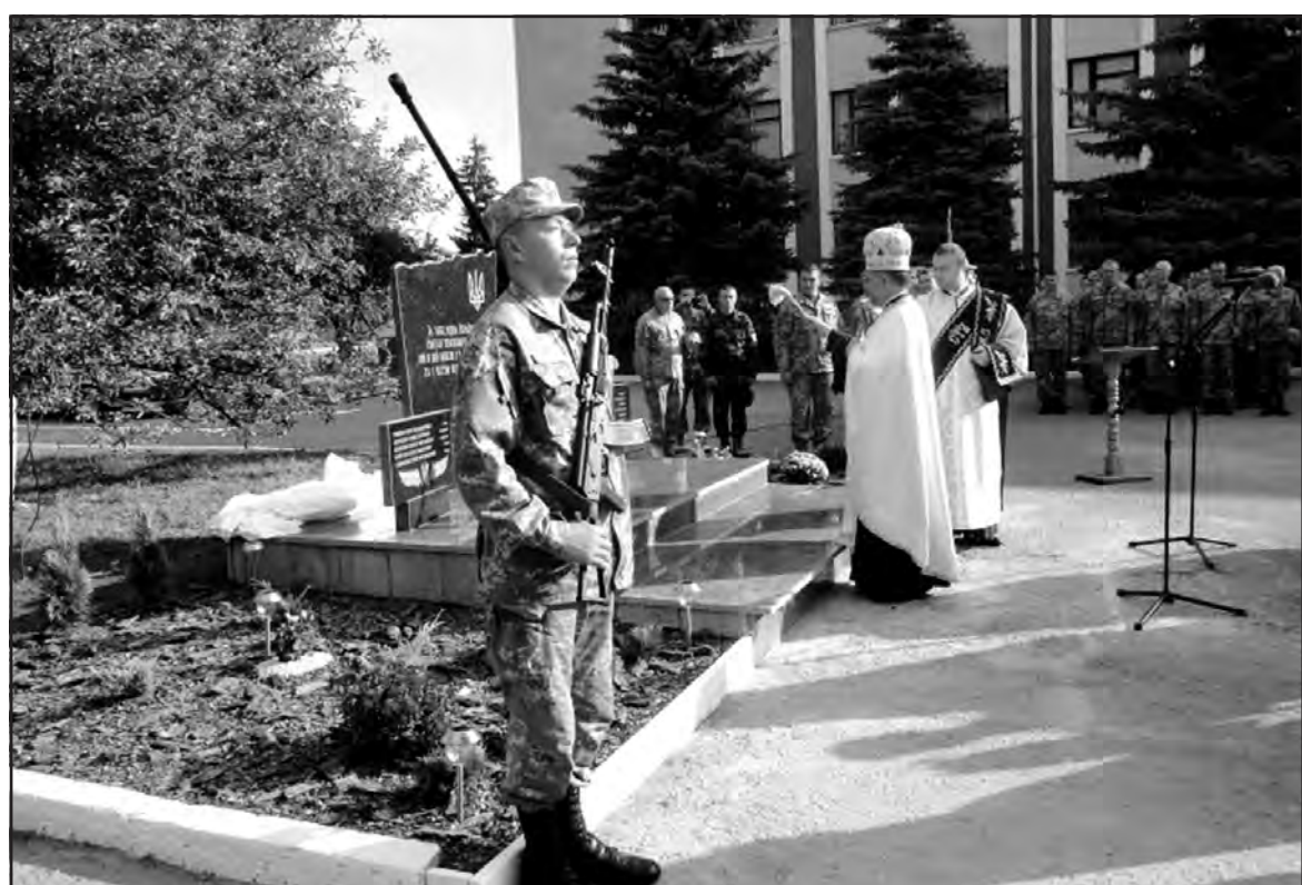
На території 44-ої окремої артилерійської бригади у м. Тернополі відкрили та освятили меморіальну Стелу загиблим воїнам-артилеристам.