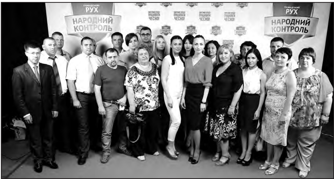
Команда “Народного контролю” Тернопільщини.

Зі скаргами, запитаннями та пропозиціями також можна дзвонити на “телефон довіри” Державної фінансової інспекції України за номером (044) 425-38-18.