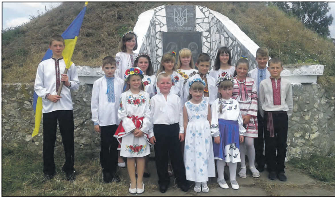
Учасники відзначення 24-ї річниці Незалежності України у с. Домаморич.