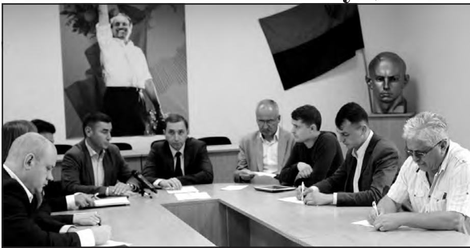
Учасники круглого столу, який відбувся з ініціативи ТОО політичної партії “Блок Петра Порошенка “Солідарність” 4 вересня ц. р.

“Від включення цього посилання до прийнятого закону (про особливий порядок самоврядування) залежить міжнародна підтримка України. Загострення уваги виключно на питанні Донбасу відволікає увагу від головної мети конституційних змін – децентралізації влади. Відбувається злам російської моделі управління державою, що остаточно від-