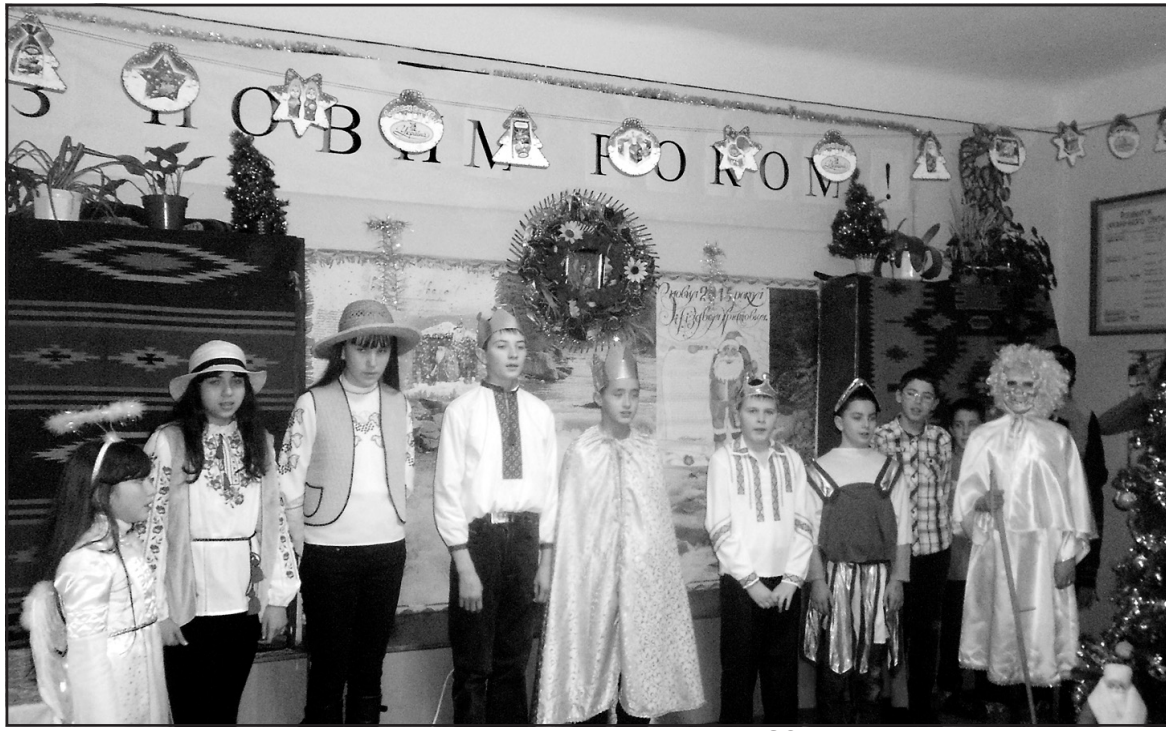
Учасники Різдвяного вертепу у Білецькій ЗОШ І-ІІ ст.

На завершення усіх присутніх звеселив Різдвяний вертеп, в якому учні майстерно грали свої ролі, засівали, віншували та просили Бога, щоб послав мир і спокій нашій рідній землі.