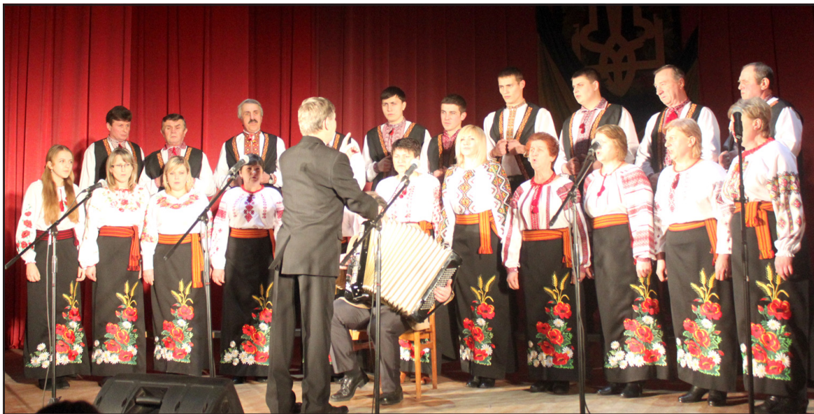
На сцені Байковецького будинку культури виступив народний аматорський хор клубу села Шляхтинці.

Народної Республіки. 22 січня 1919 року на Софійському майдані в Києві відбулося урочисте оголошення універсалу про об'єднання УНР і ЗУНР у соборну Україну. Тодішні українські чиновники не розуміли, що новостворену державу потрібно захищати зі зброєю і розформували мільйонну боездатну армію. Щось подібне спостерігаємо сьогодні... На жаль, ми не робимо належних висновків з уроків історії. Свободу і незалежність людини виборює сама за допомогою Божої волі.