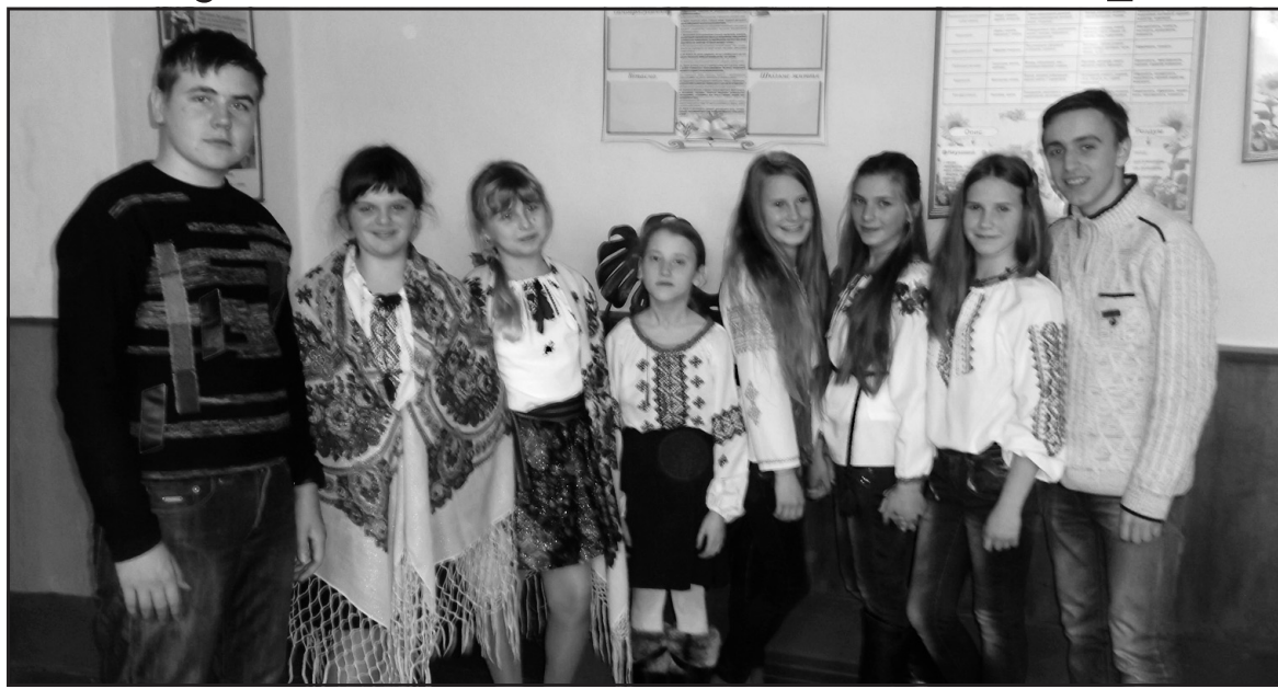
• Героям слава!

У грудні відзначаємо День Збройних сил України. Учнівський комітет нашої школи "Лідер", а саме прекрасна його половина, наші дівчата, вирішили зробити хлопцям приємний сюрприз. Вони підготували для наших майбутніх захисників конкурсну-розважальну програму "Ой, чий то кінь стоїть".