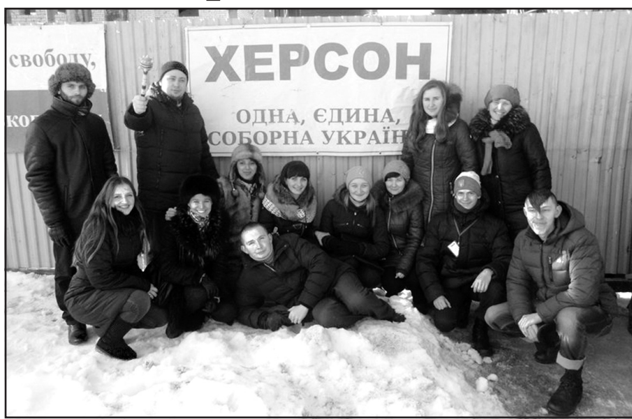
Учасники Товариства українських студентів-католиків “Обнова” з херсонськими волонтерами.

На Святвечір мали спільну молитву та святкову пісню вечерю із отцями та братами монастиря. Хоча ми були далеко від дому і своїх рідних, але під час вечері панувала домашня атмосфера. Ніч перед Різдвом була плідною: спілкувалися з римокатолицькими сестрами, розділили з отцем