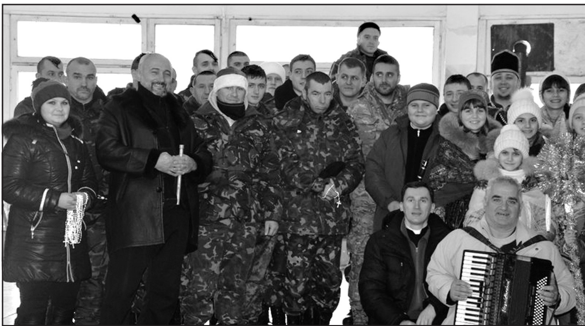
“Обновляни”, жителі м. Скадовська та бійці Тернопільського батальйону “Збруч”.

розі були вночі, люди не спали, а приєднувалися і просили заколядувати ще з ними. Через коляду на Різдвяні свята кожна людина може впустити в своє серце новонародженого Ісуса.