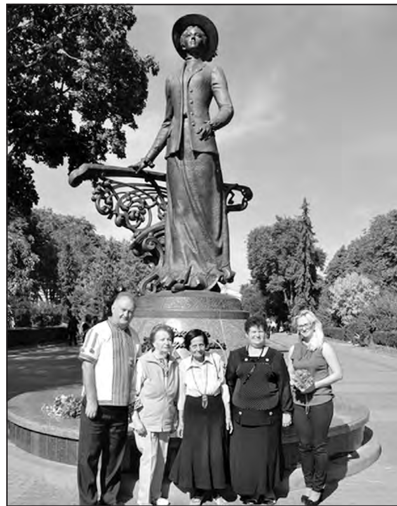
Шанувальники творчості Соломії Крушельницької біля пам'ятника славетній землячці у м. Тернополі.