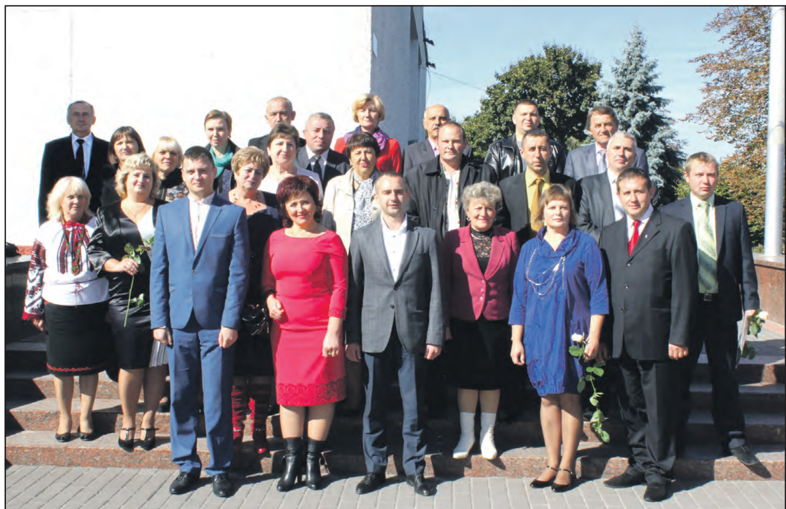
Керівники загальноосвітніх шкіл Тернопільського району під час відзначення Дня працівників освіти з головою Тернопільської райдержадміністрації Олександром Похилим (у центрі) і начальником відділу освіти Тернопільської РДА Василем Цалем (крайній ліворуч у першому ряду). 2 жовтня 2015 року.