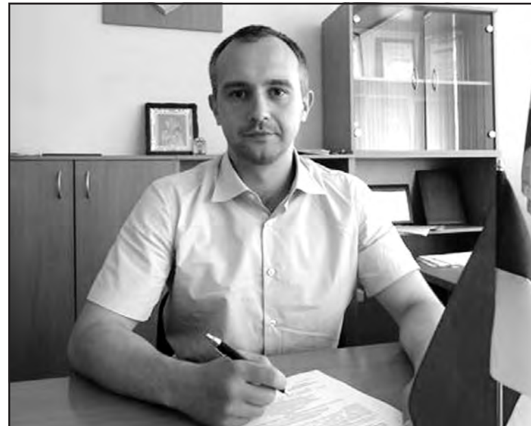
Голова Тернопільської райдержадміністрації Олександр Похилій.

Також він наголосив, що місцеві вибори — унікальна можливість повністю завершити процес перезавантаження влади і продовжити реформи президента на місцях.