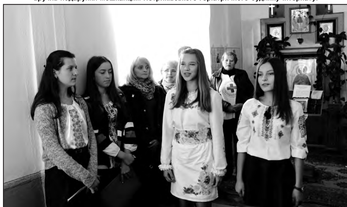
Учні Мишківської ЗОШ І-ІІІ ступенів привітали стареньких піснями та віршами.