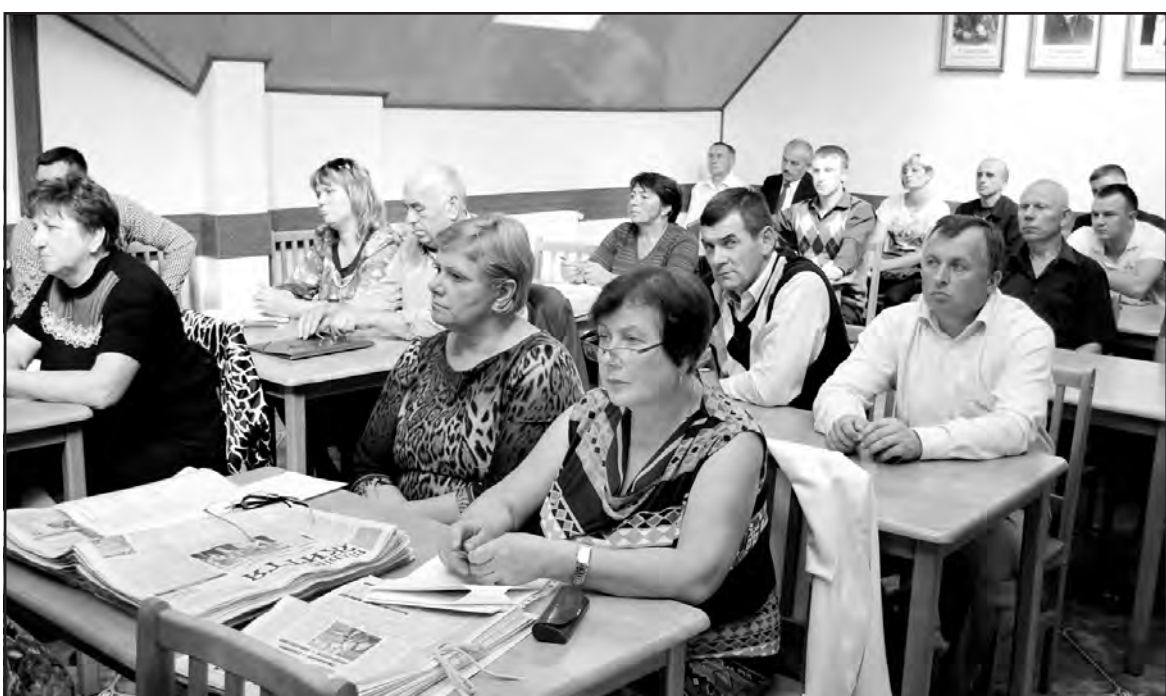
Учасники конференції Тернопільської районної організації партії “Блок Петра Порошенка “Солідарність”.