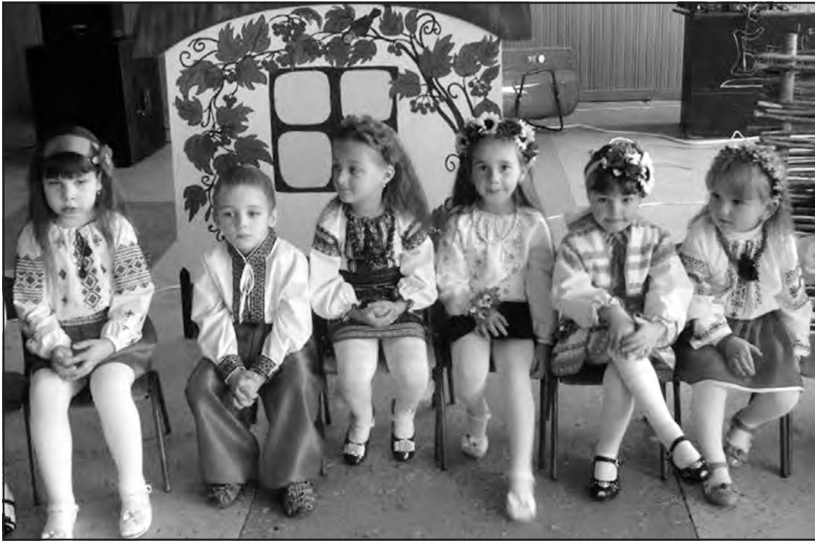
Вихованці дитячого садка "Метелик" під час заходу "Ми роду козацького діти" в будинку культури с. Байківці.