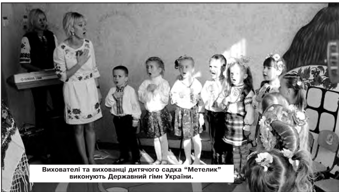
Вихователь та вихованці дитячого садка "Метелик" виконують Державний гімн України.