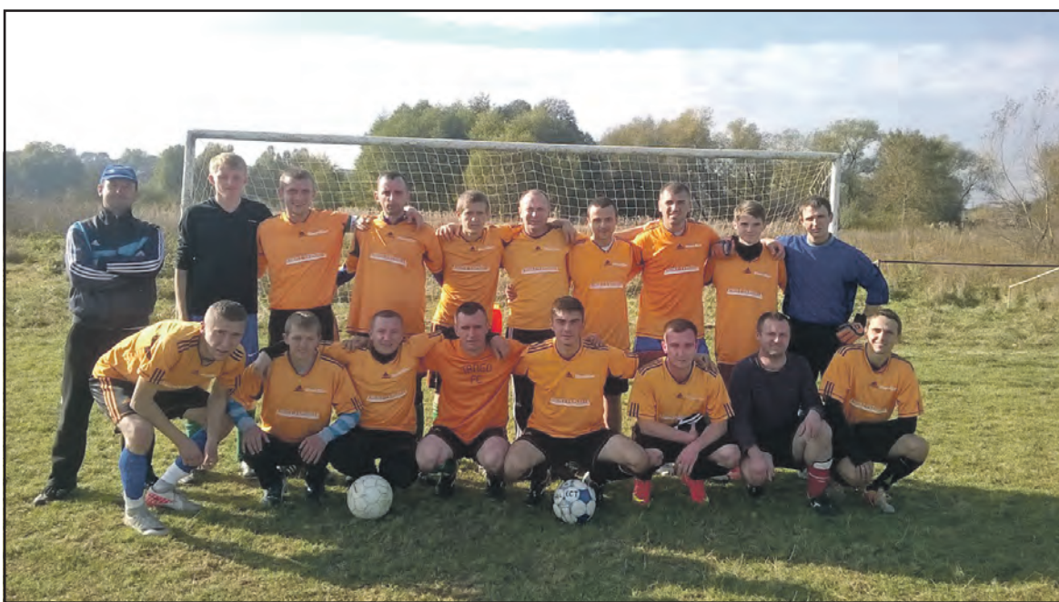
Футбольна команда «Сокіл» (Байківці) посіла у турнірній таблиці першої ліги чемпіонату Тернопільського району п'яту сходинку.