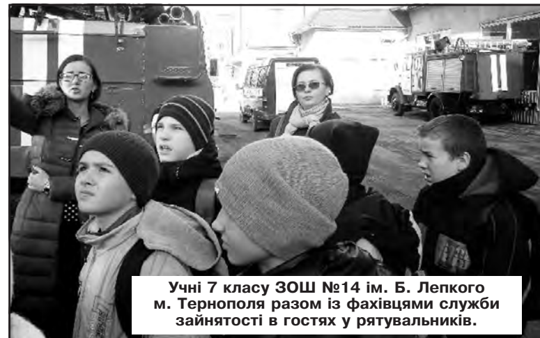
Учні 7 класу ЗОШ №14 ім. Б. Лепкого м. Тернополя разом із фахівцями служби зайнятості в гостях у рятувальників.