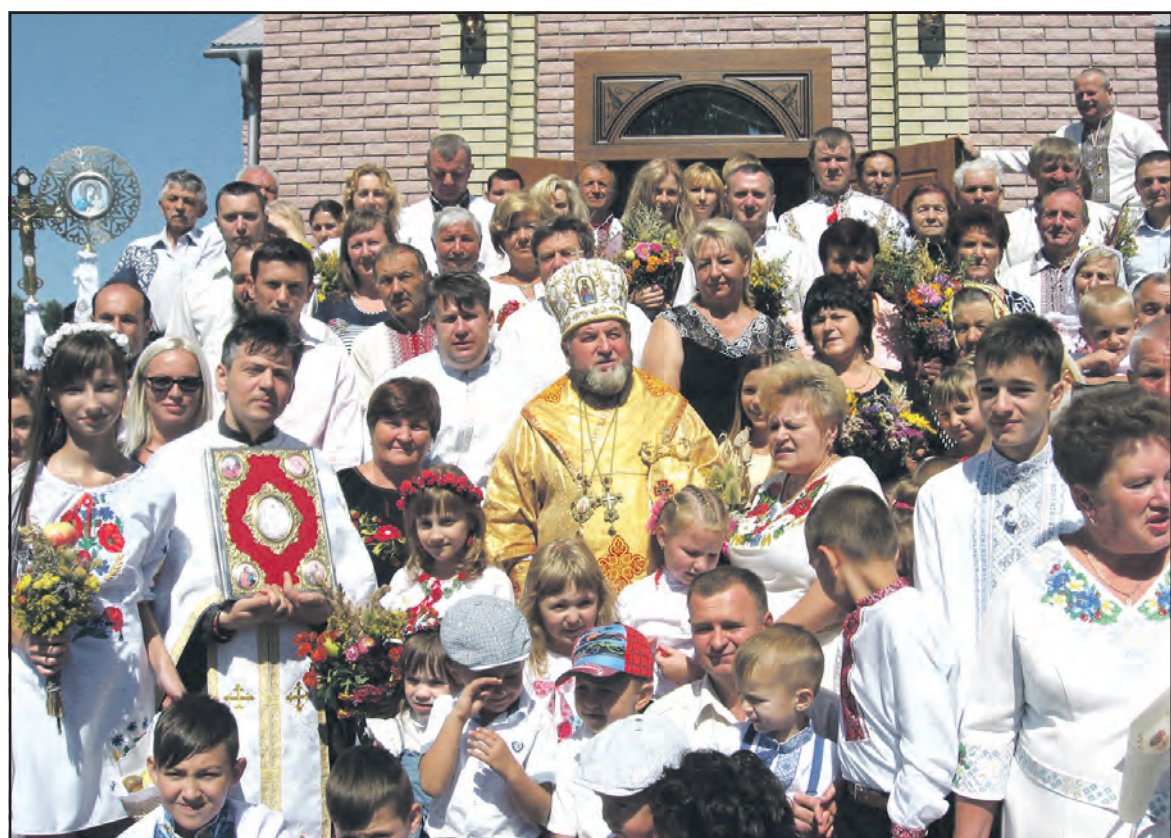
19 серпня, у день Преображення Господнього у Байківцях на масиві Гаї Чумакові урочисто відкрили новий храм Преображення Господнього. На фото: Архієпископ і Митрополит Тернопільсько-Зборівської єпархії УГКЦ кир Василій Семенюк серед парафіян церкви Преображення Господнього та гостей свята.