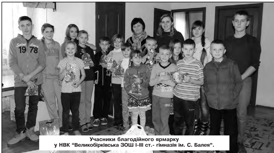
Учасники благодійного ярмарку у НВК "Великобіроківська ЗОШ I-III ст.- гімназія ім. С. Балає".