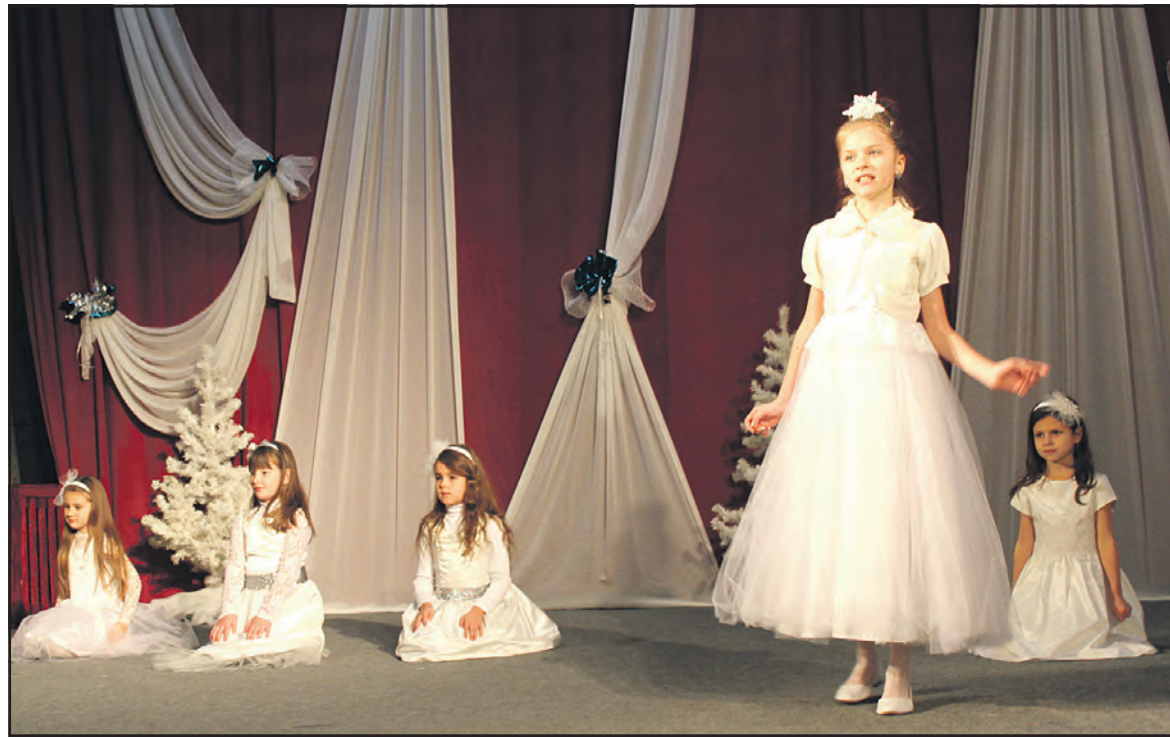
Юні вихованці Тернопільської музичної школи №2 імені Михайла Вербицького в ролі новорічних сніжинок.

У школі функціонують фортепіанний, струнно-смічковий відділи, відділ сольного співу, відділ народних інструментів, відділ духових та ударних інструментів, відділ музично-теоретичних дисциплін, відділ "Музичне мистецтво естради". 90 викладачів навчають мистецтву музики 615 учнів. Дітей на навчання (платна форма) приймають із 5-річного віку за результатами вступного іспиту. Для пільгових категорій навчання безкоштовне. Майстерність кожного учня перевіряють під час академіч-