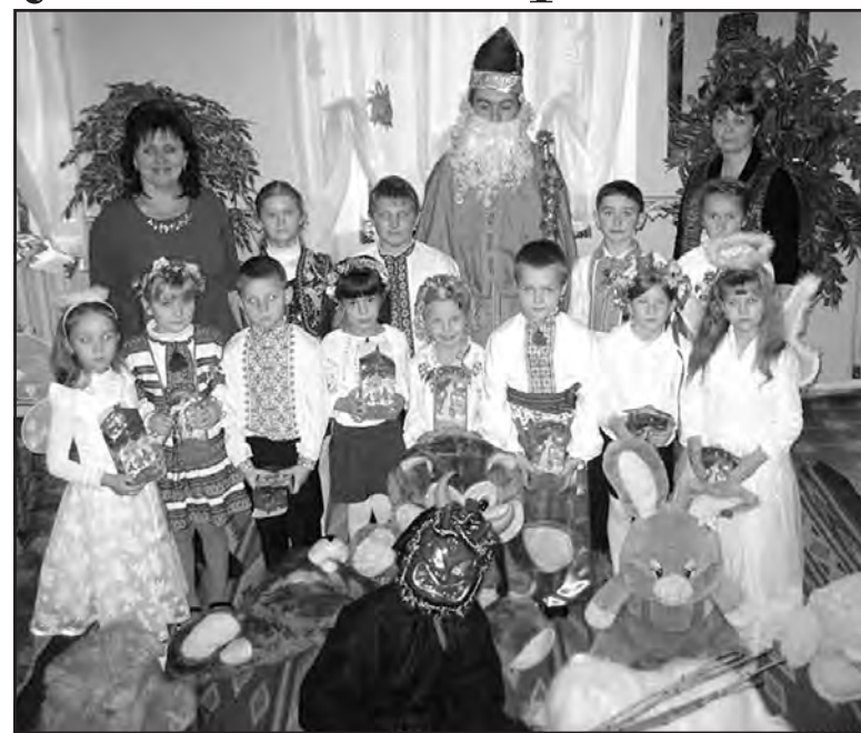
Учасники урочистостей з нагоди Дня святого Миколая у Байковецькій ЗОШ І-ІІ ст., 18 грудня 2015 року.

В рамках дійства школярі співали, розказували вірші, а в наприкінці кожен учень отримав солодкі подарунки від Святого