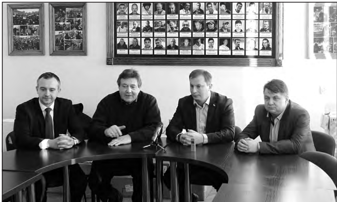
Голова Тернопільської РДА Олександр Похилий, Байковецький сільський голова Анатолій Кулик, голова Тернопільської ОДА Степан Барна, голова Тернопільської обласної ради Віктор Овчарук зустрілися з представниками Байковецької об'єднаної територіальної громади.

цього року наприкінці серпня. На електрифікацію витратили близько 2 мільйонів гривень, з яких 959 тисяч — із Державного фонду регіонального розвитку, 838 тисяч — із Байковецького сільського бюджету, 124 тисячі гривень — з інших джерел фінансування. Газифікацію житлового масиву "Приміський" провели за кошти сільського бюджету. До Нового року плануємо завершити тут встановлення вуличного освітлення. Тернопільська обласна рада затвердила перспективний план формування територій громад області, що дає можливість з початку наступного року перейти на прями міжбюджетні відносини з державою. Розвиватимемо Байковецьку об'єднану територіальну громаду за рахунок різних джерел фінансування — залучатимемо кошти Державного фонду регіонального розвитку, подаватимемо проекти для отримання міжнародних грантів. На 2016 рік розробили два проекти з ремонту доріг у Шляхтинцях, встановлення обладнання для вуличного освітлення в Курниках, Лозові і Стегниківцях, із ремонту даху в Лозів-