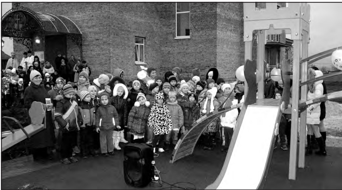
Великогаївська дівчача на дитячому майданчику, відкритого на честь опіки праведного митрополита Андрея Шептицького.

А в церкві у цей чудесний вечір не стихали дитячі пісні, колядки, віншування, вертепні дійства. Діти показали все, чого їх навчила катехит Віта Семанчик, добрий пастир о. Роман. Від різнобарв'я вишиваних костюмів стало добре на душі. Так дівчора вшанувала Бога, митрополита Андрея Шептицького, святого Миколая, чия доброта не має меж та існує поза часом.