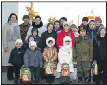
У новорічній казці завжди щасливий кінець.