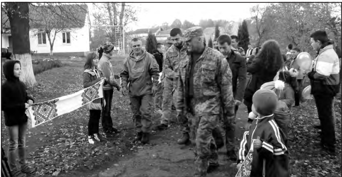
Так зустрічали воїнів АТО у Жовтневій ЗОШ I-II ст. ім. В. Гарматія, листопад 2015 р.