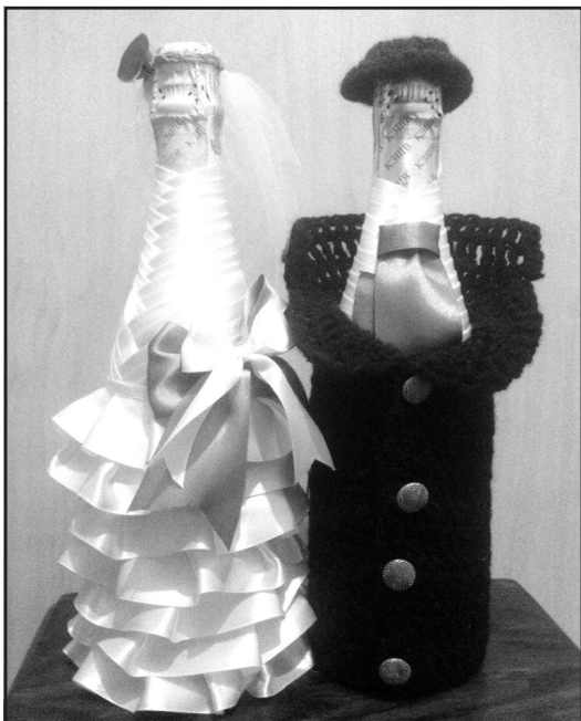
“Декоративні молодята” — це відповідно оздоблені пляшки з-під шампанського.