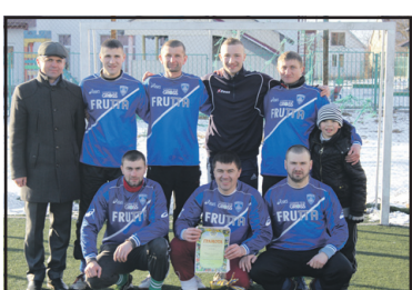
Кубок з міні-футболу пам'яті Героїв Крут.

www.trrada.te.ua - веб-сторінка Тернопільської районної ради