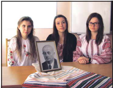
Відкритий урок, присвячений 130-річчю Степана Балея.