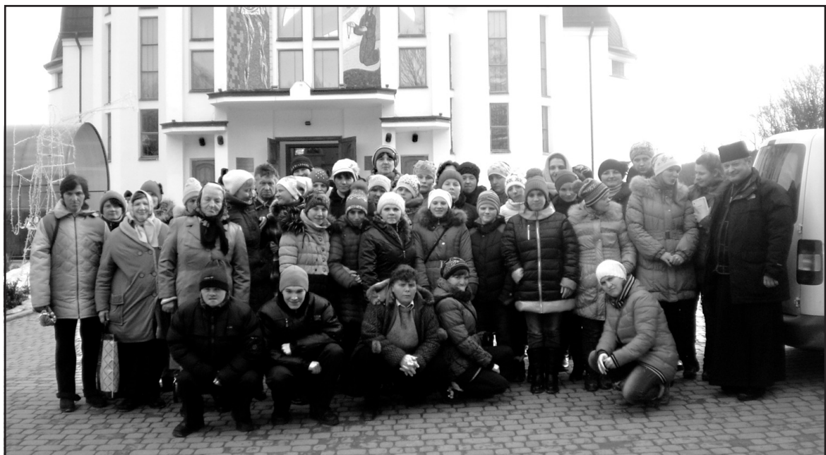
Вихованці Петриківського обласного комунального будинку-інтернату та Петриківського геріатричного пансіонату відвідали Марійський духовний центр Зарваницю.