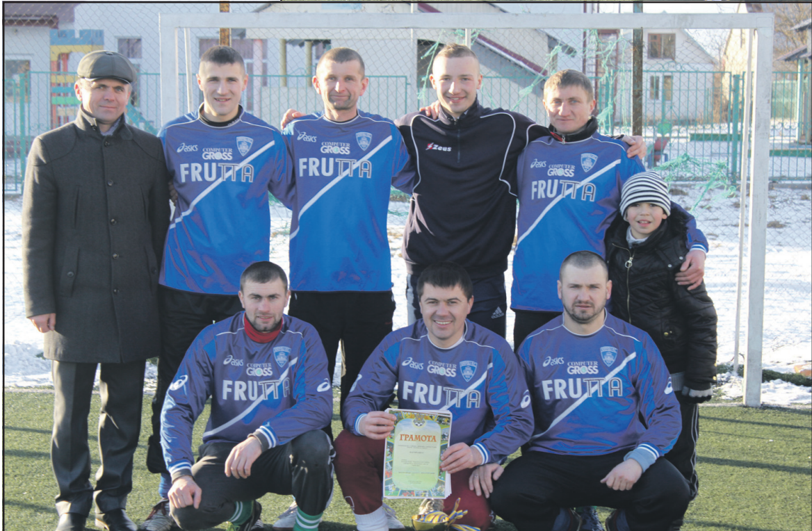
Переможець Кубка Тернопільського району з міні-футболу пам'яті Героїв Крут — команда с. Шляхтинці.

Команди шляхом жеребкування розподілили на чотири групи. По дві найкращі команди вийшли до фінальної стадії турніру. Кращими в своїх групах стали футболісти Великого Глибочка, Дубівців, Великих Бірок, Шляхтинців, Вели-