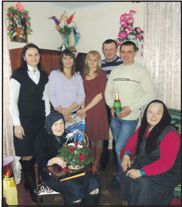
“Живіть до ста”: джерела вікової мудрості.