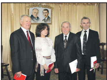
“Для України треба не тільки вмирати, але й жити!” — цьогорічні лауреати премії ім. братів Лепких.