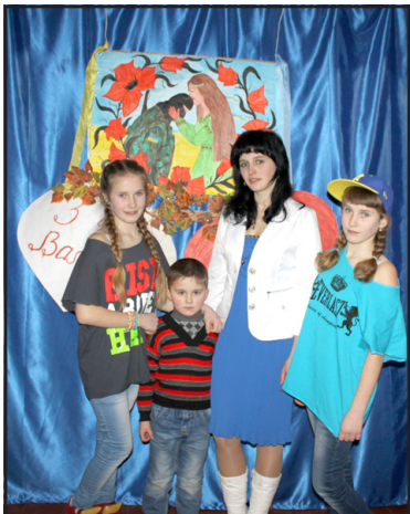
Чи можна поєднати кохання і війну?