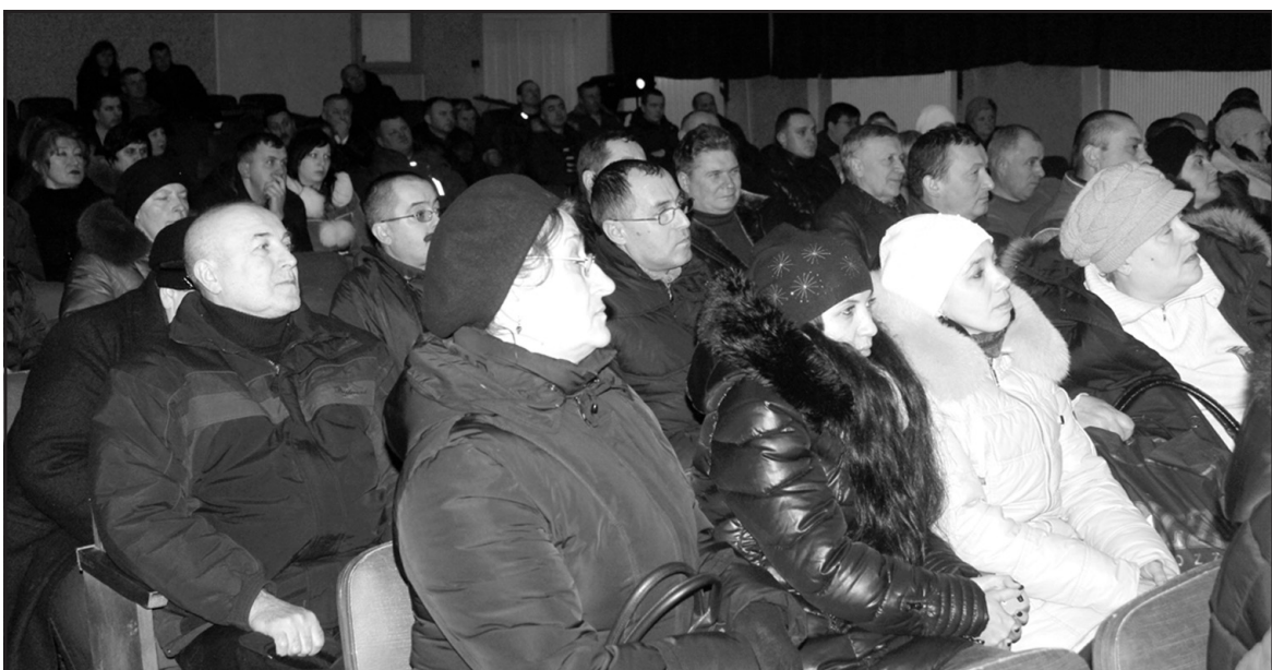
Учасники зборів щодо продовження будівництва багатоквартирного будинку на вул. Корольова в с. Байківці.

* У межах генерального плану Байковецької сільської ради є тринадцять масивів: Байківці, Гаї Чумакові, Гаї Ходорівські, Русанівка, Європейський, Зоряний, Сонячний, Північний, Центральний, Подільський, Галицький, Ліщина, Приміський. Найбільший масив — Сонячний.