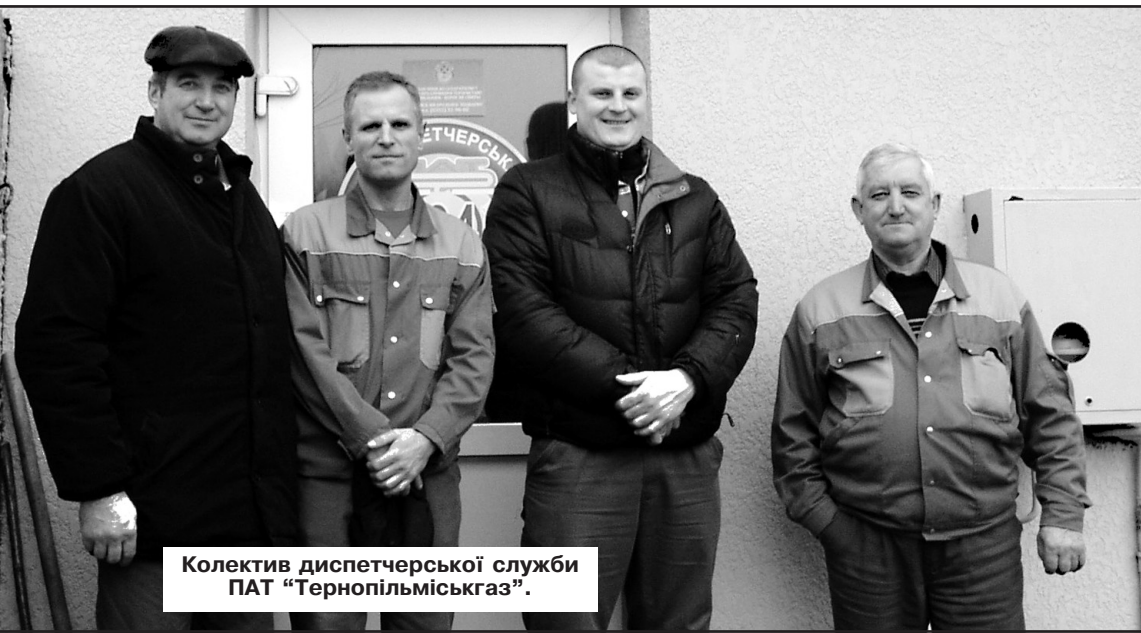
Колектив диспетчерської служби ПАТ "Тернопільміськгаз".