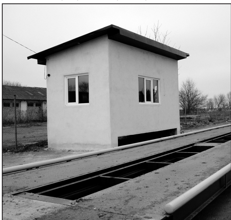
Багатотоннажна електронна вага, встановлена ПП «Агрон» у Малому Ходачкові.