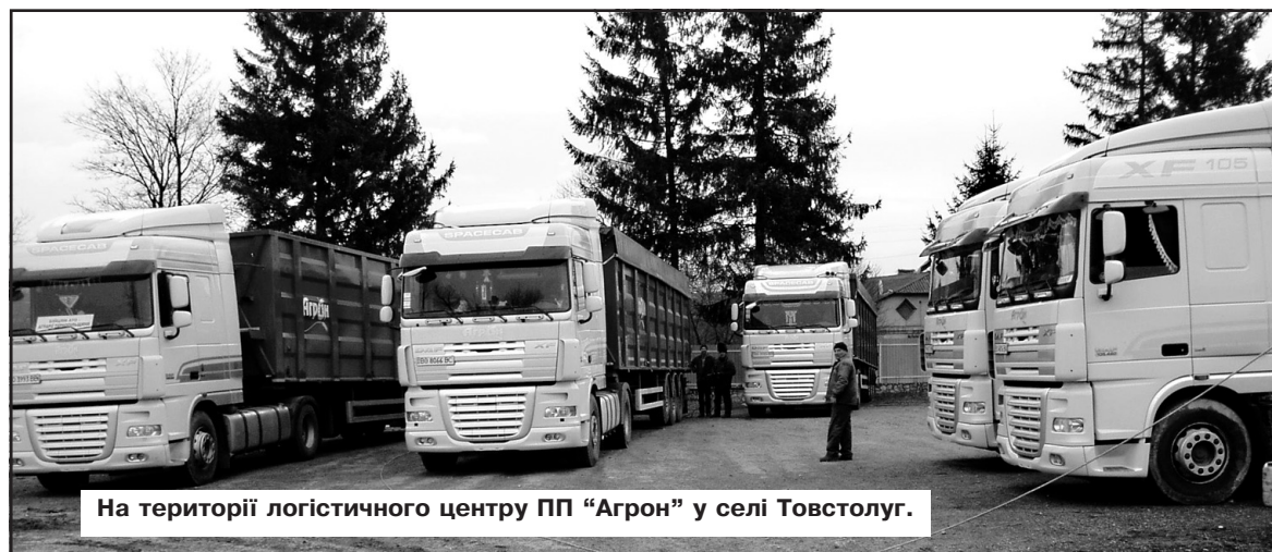
На території логістичного центру ПП "Агрон" у селі Товстолуг.