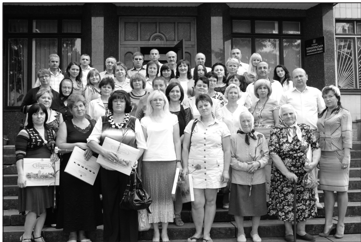
Учасники урочистостей з нагоди вручення відзнак "Мати-героїня" багатодітним матерям Тернопільського району.