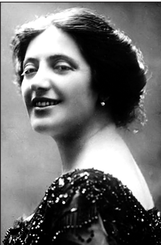
Соломія Крушельницька, 1928 р.

Тернопіль — це місто Соломії. Перед нею і її талантом схилиють голови тернопольяни. Мандруючи містом, зустрічаємось із старими будівлями, пам'ятниками, меморіальними дошками, які доповнюють розповідь про славетну Соломію. У сквері на вул. Грушевського зупиняємось біля пам'ятника Т. Г. Шевченку, який відкрито у 1982 р. Поет відіграв велику роль у житті Соломії Крушельницької. Родинним святилищем для Крушельницьких був