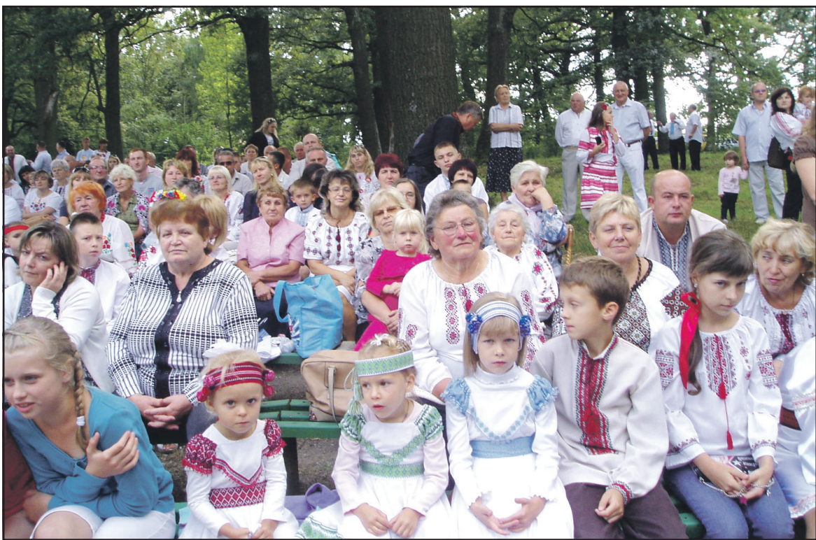
Учасники святкувань, приурочених до Дня незалежності України, у Великих Гаях.

Завершилися урочистості дискотекою по-українськи, святковою ватрою, феєрверками.