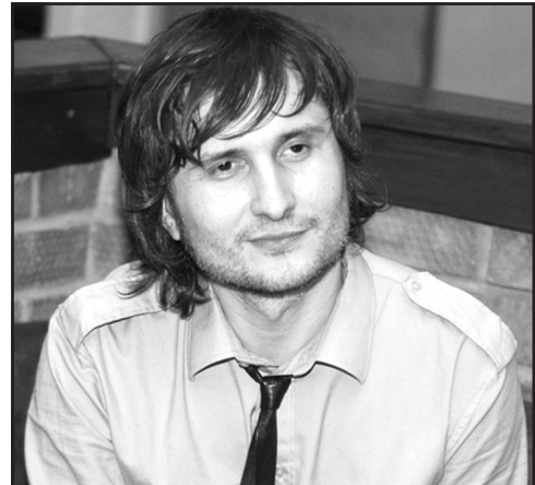
Фронтмен гурту "Мері" Віктор Винник.

25 січня, у день Тетяни та в студентське свято, Тернопіль співав голосом гурту "Мері", який вдруге відвідав наймістечкіший паб файного міста — "Хмільне щастя". Напередодні концерту з журналістами зустрівся автор творчої спадщини групи "Мері", медіум соціального болю і глибоко філософської емоції українців — Віктор Винник. Якими секретами він поділився з тернополянами, читайте далі.