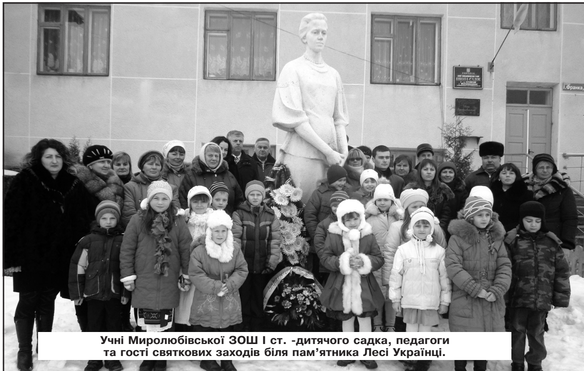
Учні Мироліубівської ЗОШ І ст. - дитячого садка, педагоги та гості святкових заходів біля пам'ятника Лесі Українці.