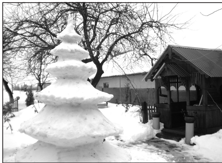
На подвір'ї сім'ї Гоч у Жовтневому навіть сніг – матеріал для мистецтва.

доліки учнів з надією, що вони критично оцінять свою поведінку і спробують змінити її. Таке виховання вражає самоповагу, почуття власної гідності дитини. У роботі з учнями необхідно використовувати такі засоби психологічного впливу, які б не викликали реакції внутрішнього опору на дії педагога. Не секрет: проблемних учнів не буде, якщо їх правильно зацікавити предметом, який викладаєш. Будь-яка робота підносить людину, ошасливує досягненнями. Трудове виховання – це гармонія трьох понять: треба, важ-