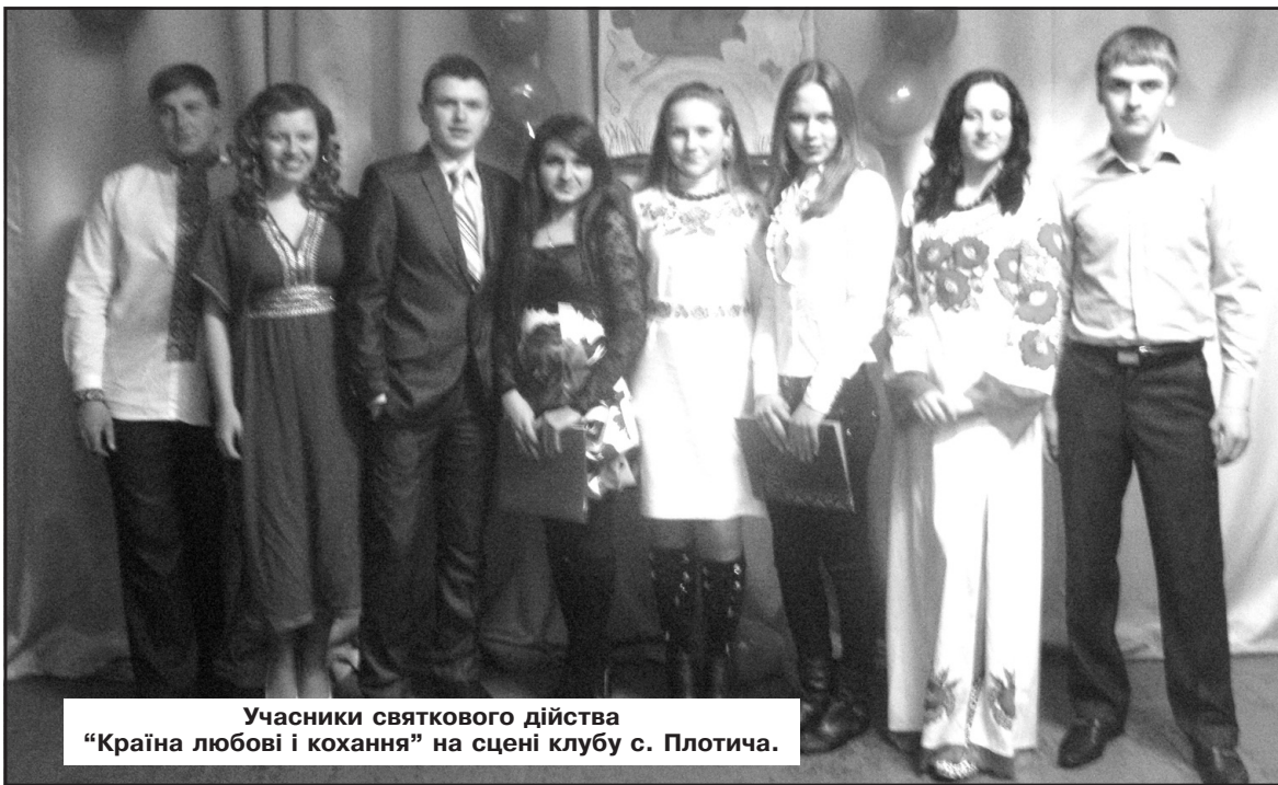
Учасники святкового дійства "Країна любові і кохання" на сцені клубу с. Плотича.