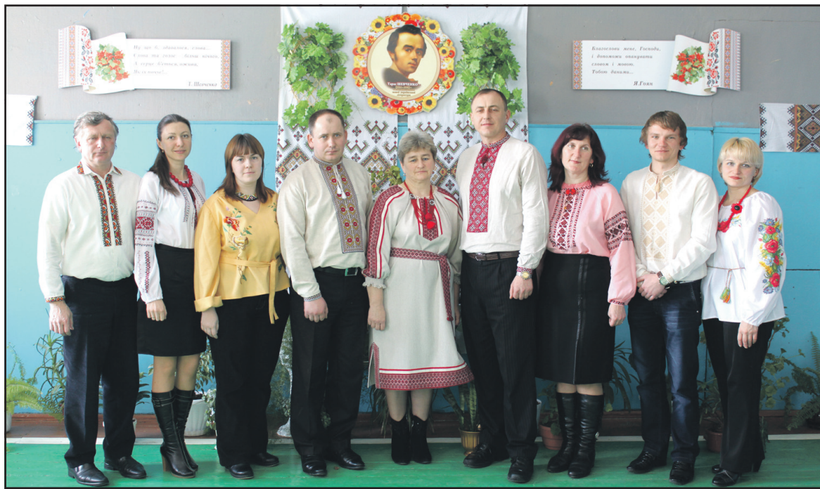
Головне завдання вчителя, за переконанням педагогів Товстолузької школи, – виховати любов до рідної мови.

– Я також міг би сказати, що моя мова – це мова незрівняного сміхотворця Котляревського, мова геніального Тараса Шевченка. Це лірична мова кращої поетеси Лесі Українки, Івана Франка, який вільно володів чотирнадцятьма мовами, серед яких і названі тут. Я можу назвати ще багато славних імен свого народу, проте вашим шляхом не піду. Ви ж, зрештою, нічого не сказали про багатство й можливості своїх мов. Ну, могли б ви, приміром, своїми мовами написати невеличке оповідання, в