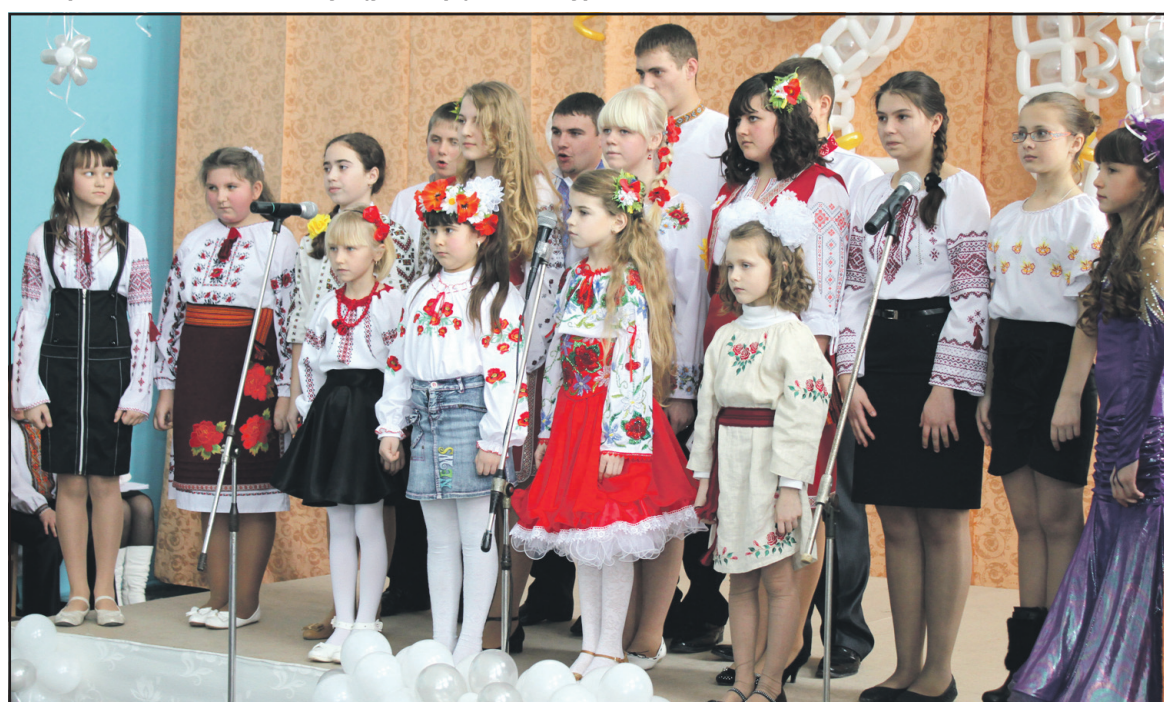
З 20-літтям рідну школу віршами, піснями, танцями і гуморесками вітали її талановиті учні.

котрий пильно слідував за кожною цеглинкою у процесі становлення школи від її фундаменту до завершального моменту, і тепер не цурається вирішувати шкільні проблеми".