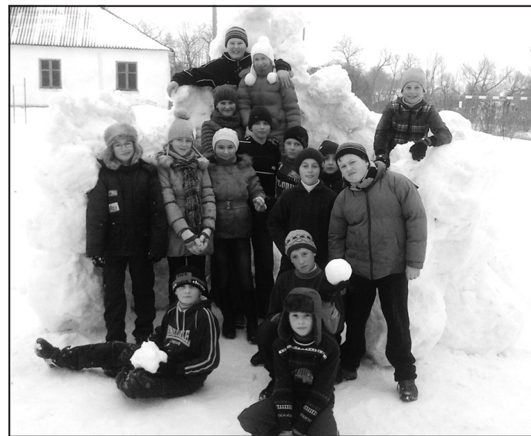
Учні Жовтневої школи на фоні новоствореної снігової фортеці.

ню з опаленням. Наразі працюю у гаражі, але взимку тут дуже холодно. У хаті робота чомусь не йде, там я звик відпочивати. Коли працюю, вмикаю радіо, або слухаю хіти 70-80 років: “Smokie”, Кріса Рі, “Modern Talking” або українські “Мандри”.