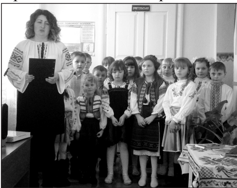
У літературно-музичній композиції учні Мироліубівської ЗОШ І ст. - дитячого садка відобразили життєвий і творчий шлях Лесі Українки.