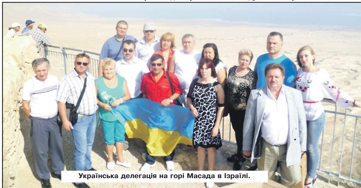
Українська делегація на горі Масада в Ізраїлі.